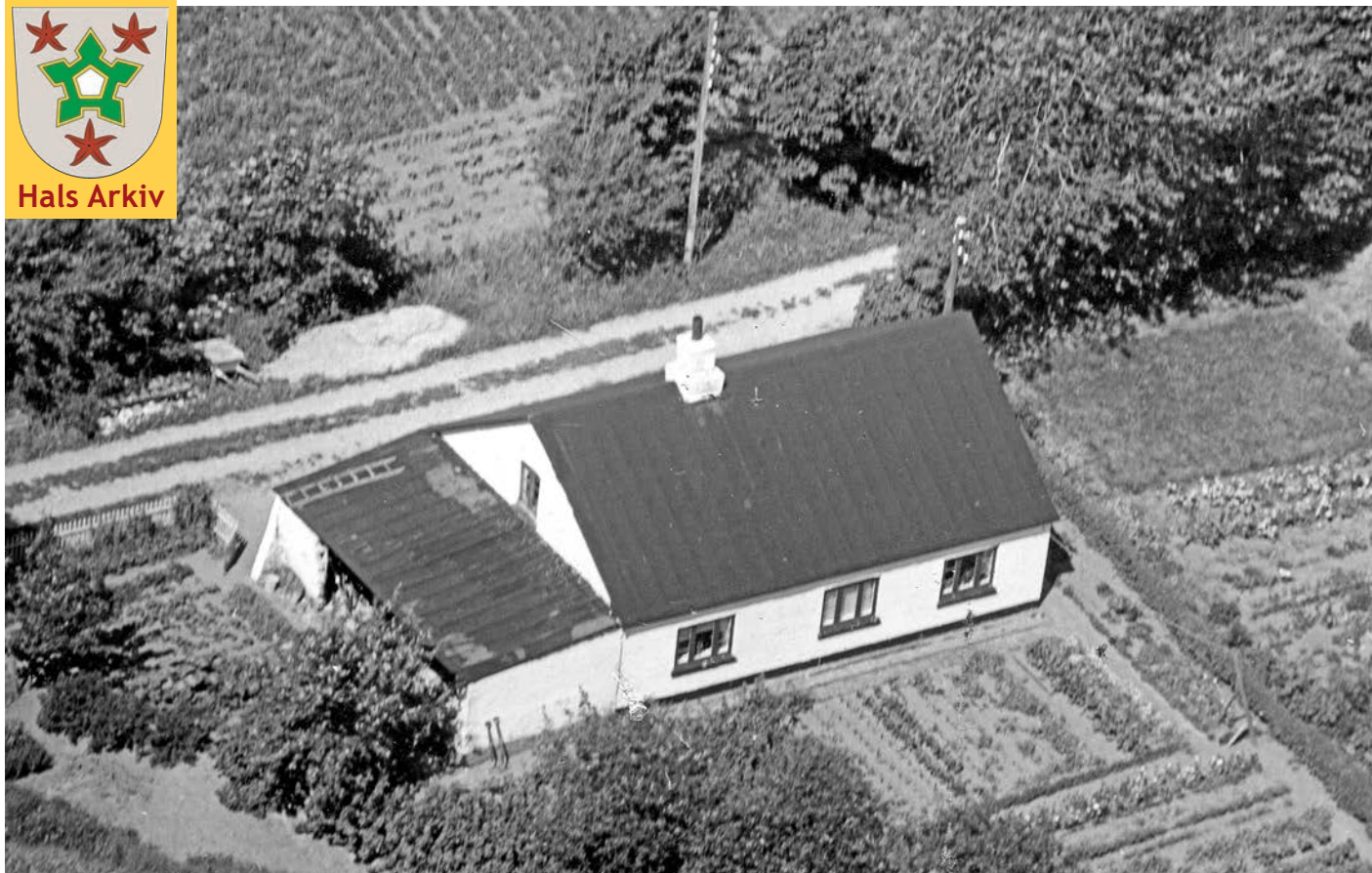
Luftfoto af Alléen 9 fra 1959.

Foto: Sylvest Jensen; Det kgl. Bibliotek. B13023 Hals Arkiv.