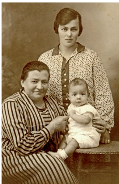
Alléen 9, foto fra 1967-72.

Foto: From Løvstrøm, Aalborg. B12680 Hals Arkiv.