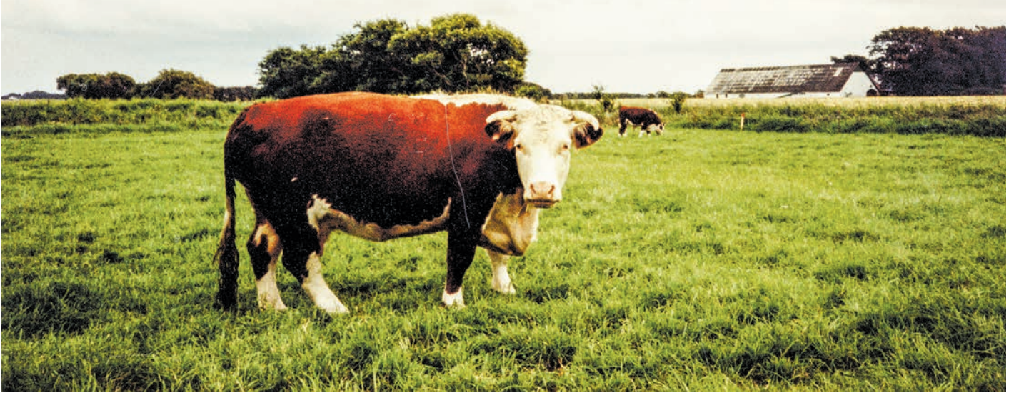
Vort Hereford kvæg på græs. I baggrunden ses Houvej 225. Fotograferet i 1988.