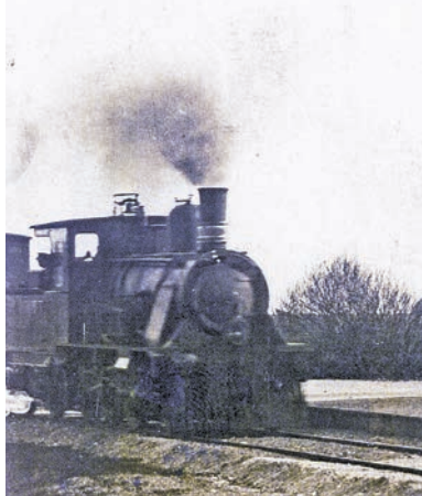
De første mange år efter åbningen i 1899 kørte dette damplokomotiv på strækningen mellem Aalborg og Sæby.