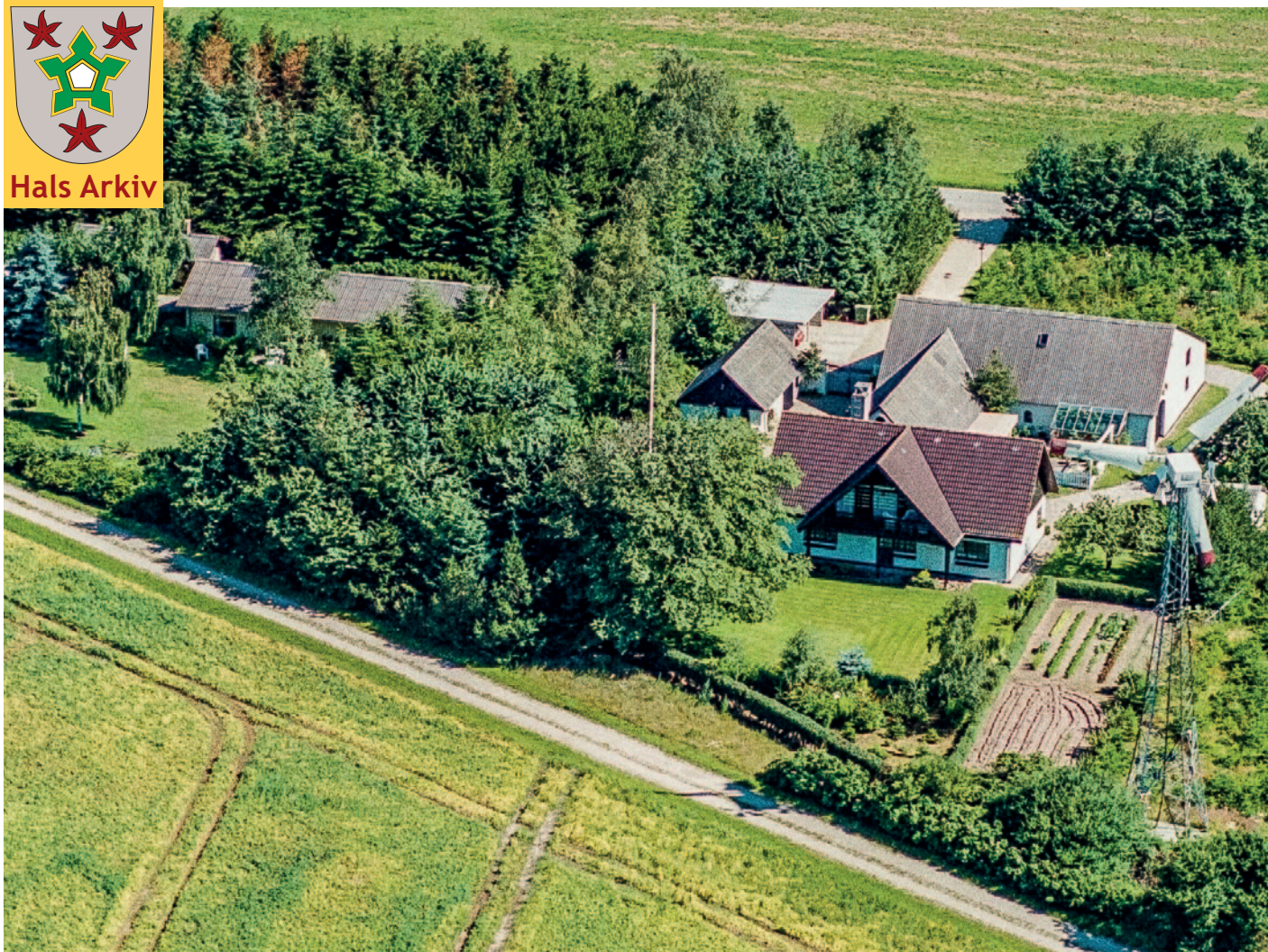
Luftfoto fra 1990 af Hedegårdsvej 20.