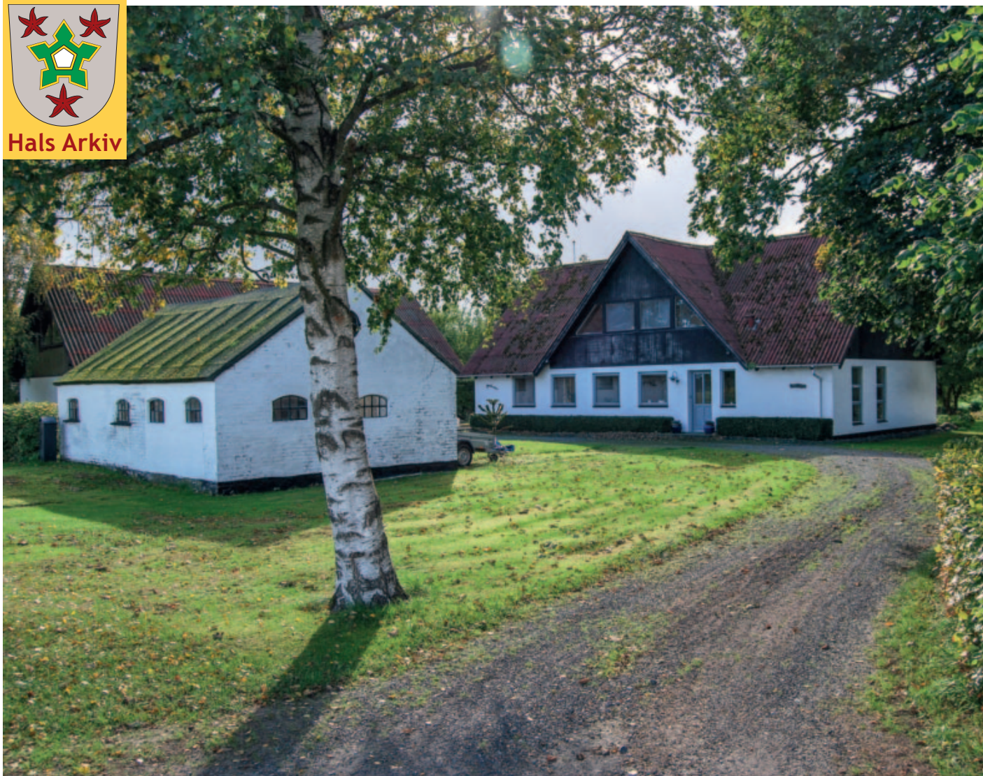
Hedegårdsvej 28 fotograferet i efteråret 2018. Foto: Ove Jakobsen Hals Arkiv, B12605.