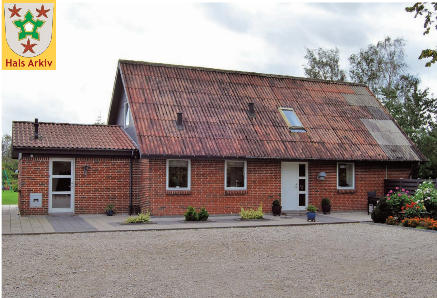
Hedegårdsvej 4 fotograferet i efteråret 2018.

2) Adkomst bruges i betydningen "besiddelse af en rettighed til noget". Et dokument, som fastslår en adkomst, f.eks. et skøde på en fast ejendom, kaldes et adkomst-dokument; i dette tilfælde er dokumentet en skifteretsattest.