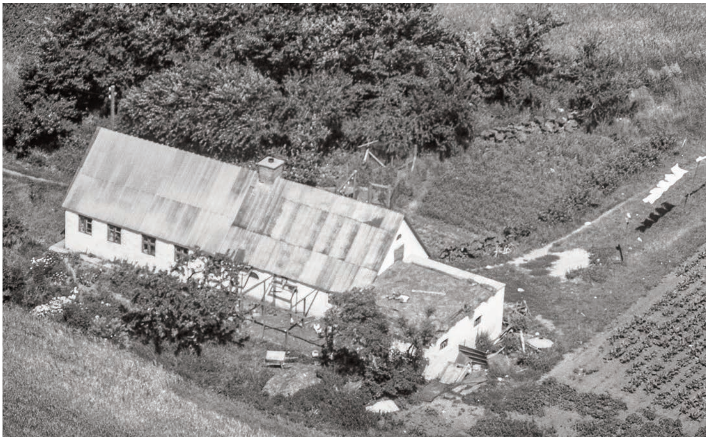
Luftfoto af Hedegårdsvej 4 fra 1959.

Foto: Sylvest Jensen; Det kgl. Bibliotek. Hals Arkiv, B13028