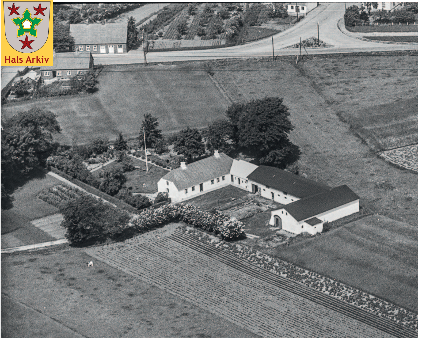
Luftfoto af Hedegårdsvej 5 fra 1948-1952.