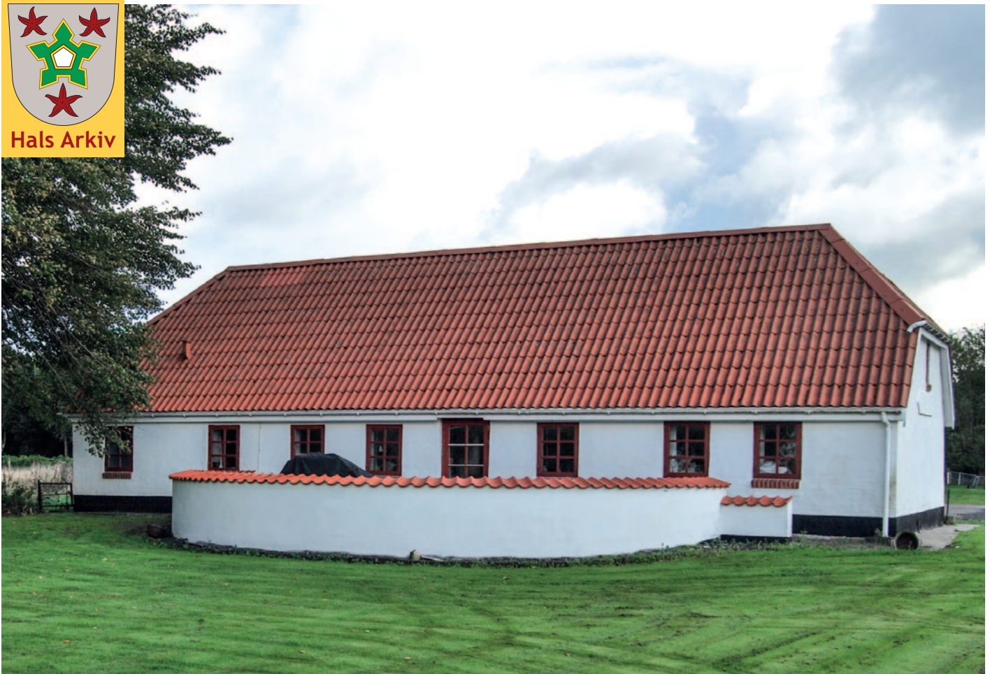
Hedegårdsvej 5 fotograferet fra havesiden i efteråret 2018. Foto: Ove Jakobsen, Hals Arkiv, B15039.

Stedet på Hedegårdsvej 5 består i dag kun af matr. nr. 70l. Matrikelnumrene 9b og 1b lægges i 1974 ind under matr. nr. 70l, og de øvrige matrikelnumre blev som tidligere nævnt stykket fra ved handlen, der fandt sted omkring 1973. Grunden er i dag på 8.858 m 2 .