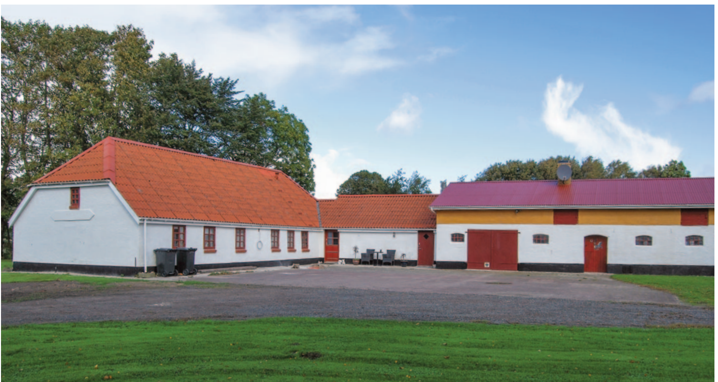
Hedegårdsvej 5 fotograferet fra gårdsiden i efteråret 2018. Foto: Ove Jakobsen, Hals Arkiv, B15040.

Stedet på Hedegårdsvej 5 består i dag kun af matr. nr. 70l. Matrikelnumrene 9b og 1b lægges i 1974 ind under matr. nr. 70l, og de øvrige matrikelnumre blev som tidligere nævnt stykket fra ved handlen, der fandt sted omkring 1973. Grunden er i dag på 8.858 m 2 .