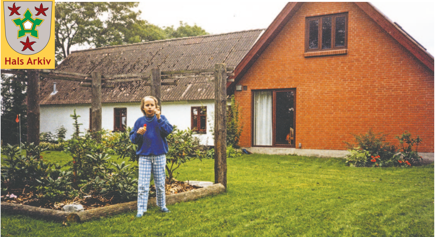
Charlotte foran den nye tilbygning til Annexgaarden, foto fra 1988.