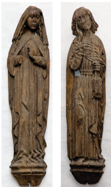
Efter en omtumlet tilværelse er de sengotiske sidealterfigurer Jomfru Maria og Johannes Døberen tilbage på nordvæggen i Hals Kirke.

Det bør for god ordens skyld oplyses, at de to sidealterfigurer nu atter befinder sig i Hals Kirke, hvor de sammen med det samtidige korbuekrucifiks er opsat på skibets nordvæg, og hvorfra de ikke længere fjernes.