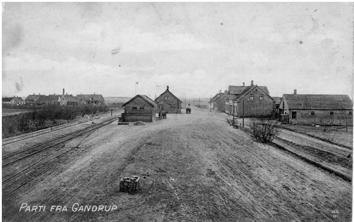
Gandrup Station kort efter åbningen i 1899, da billedet stammer fra perioden 1900-1910. Stationsbygningen ses midt i billedet og til højre for denne ses Gandrup Kro

Der blev flere steder oprettet stiklinjer på jernbanenettet, men ovennævnte planer blev aldrig før ud i livet, og Holtet, Hals og Hou blev aldrig stationsbyer. Sæbybanens sidste tog passerede Gandrup Station søndag den 31. marts 1968, efter knap 70 års virke, og herefter blev skinnerne brudt op. En epoke var forbi.