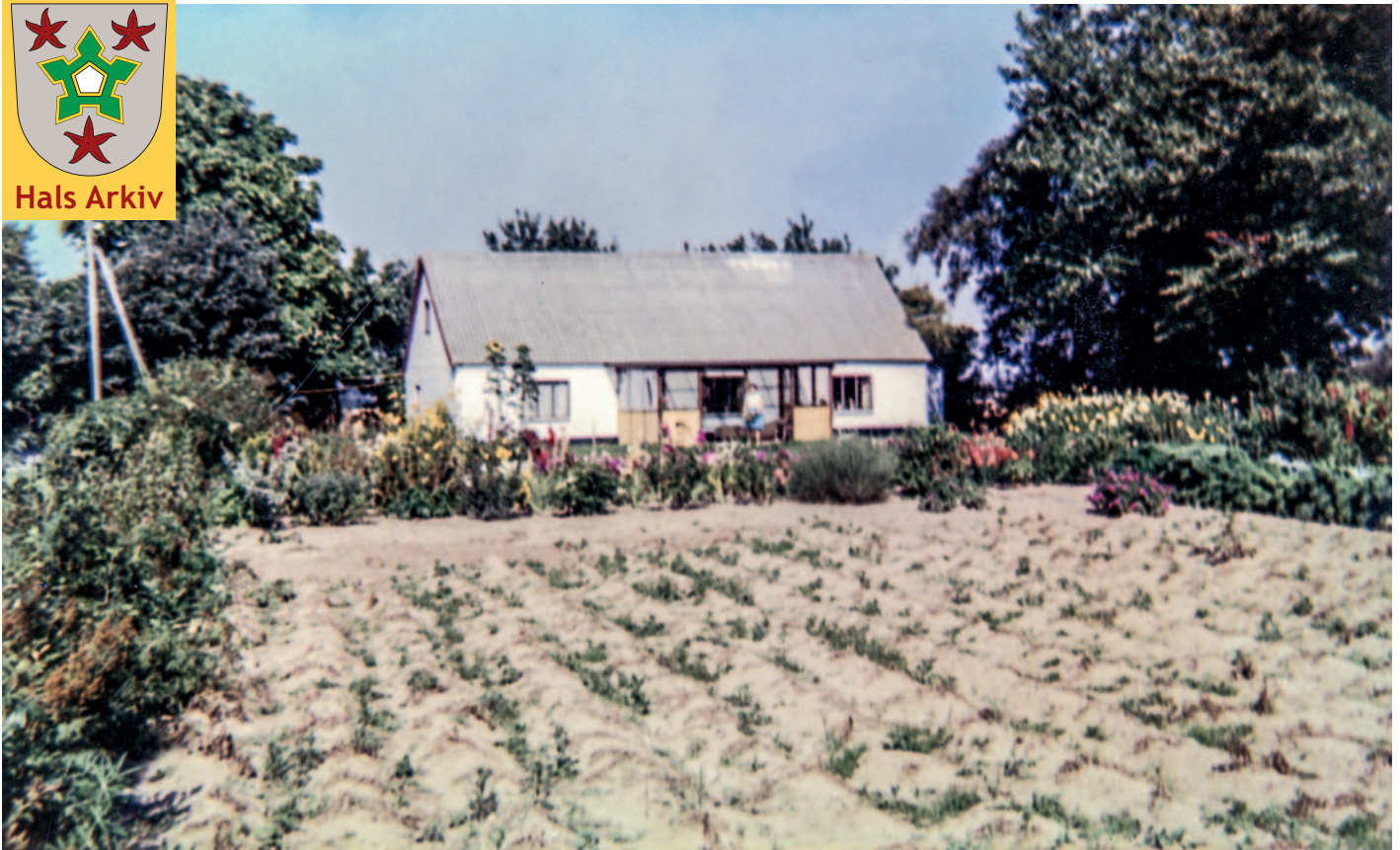
Hølundvej 76 fotograferet i 1990.