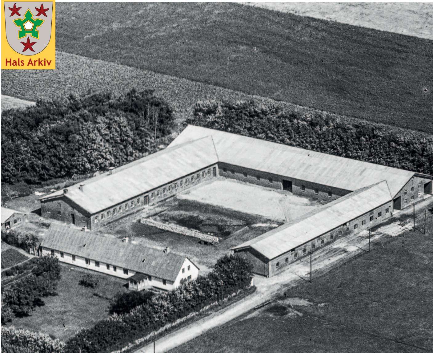
Finstrupgaard, Hølundvej 94A, fotograferet i 1946.