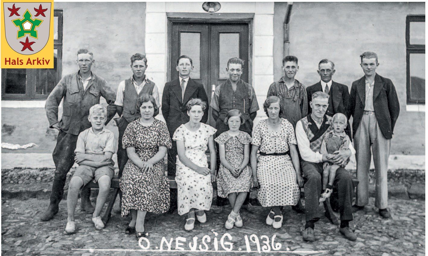
Finstrupgaard hed tidligere Øster Nejsig. Folkeholdet fra 1936 er fotograferet foran stuehuset.