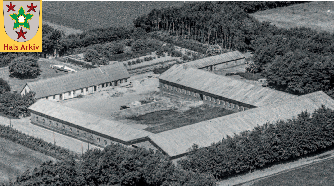
Finstrupgaard, Hølundvej 94A, fotograferet mellem 1948 og 1952.