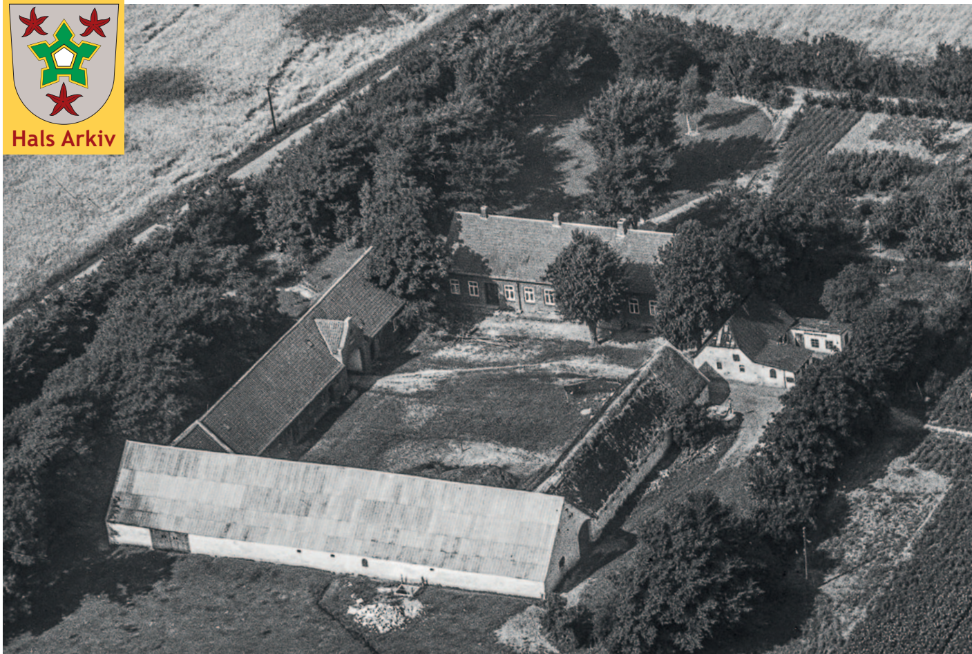
Pallisgaard fotograferet i 1946.

Foto: Sylvest Jensen, Det kgl. Bibliotek, Hals Arkiv, B12837.