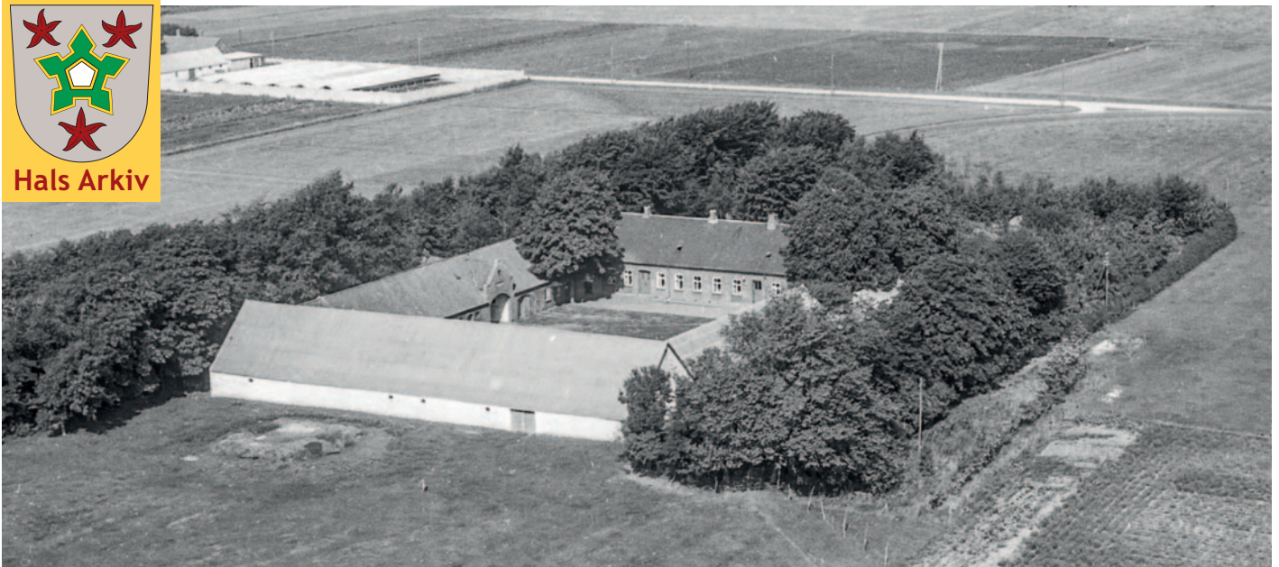
Pallisgaard på Borbergade 106 fotograferet i 1959.

Foto: Sylvest Jensen, Det kgl. Bibliotek, Hals Arkiv, B15405.