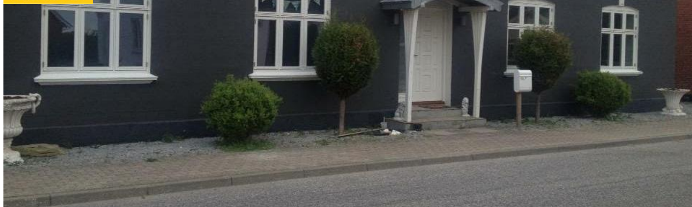
Foto taget af Dan Brixstein Hansen samme år som huset nedbrændte. Hals Arkiv, B