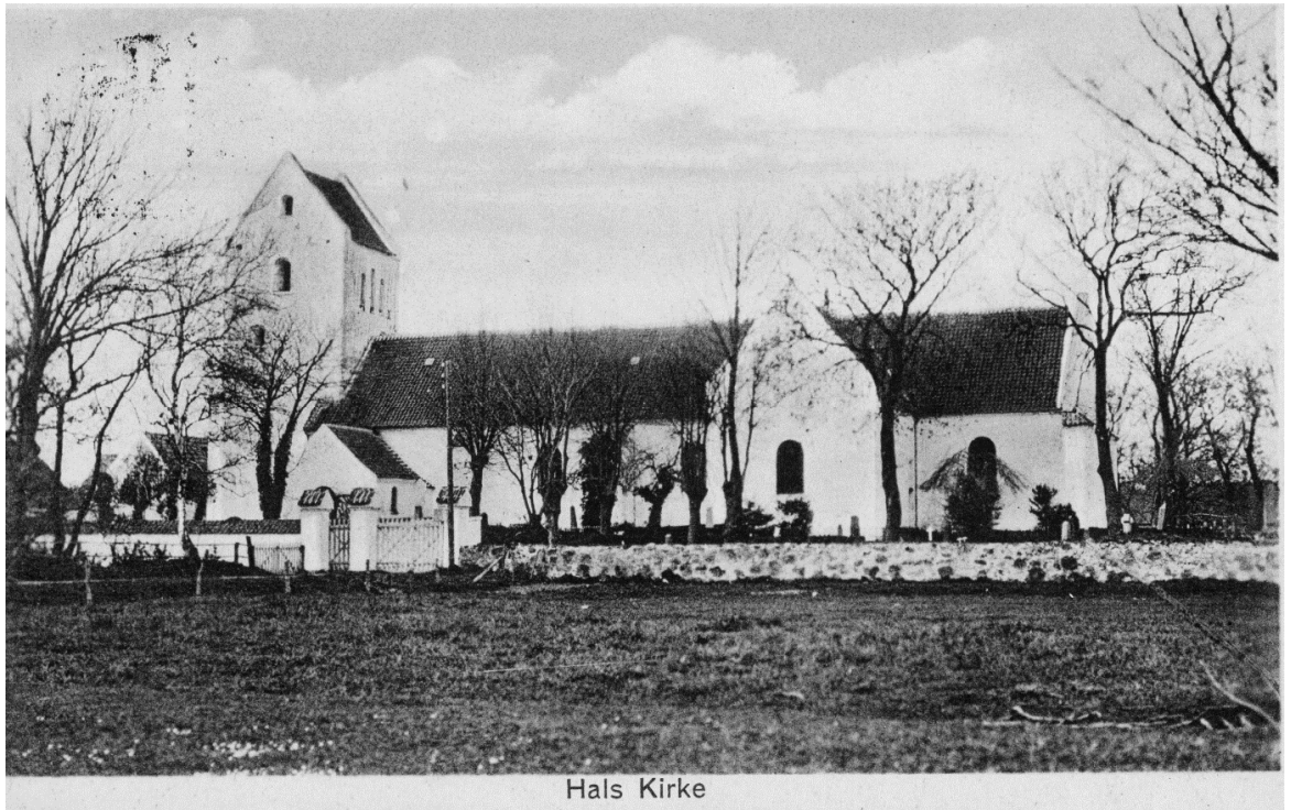
Hals kirke, Danmarks største landsbykirke ifølge forfatteren, set fra syd siden i 1928.