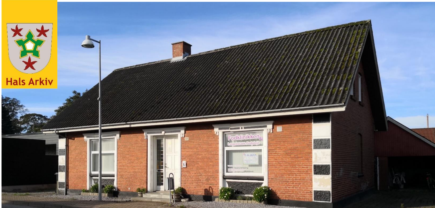
Foto taget af Tove Kaptain Christiansen, oktober 2021. Hals Arkiv, B15564