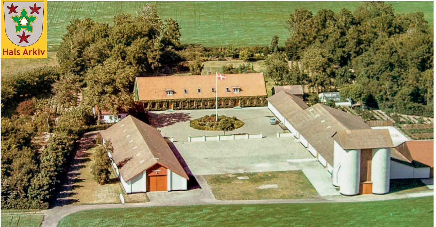
Affotograferet luftfoto fra omkring 1960.