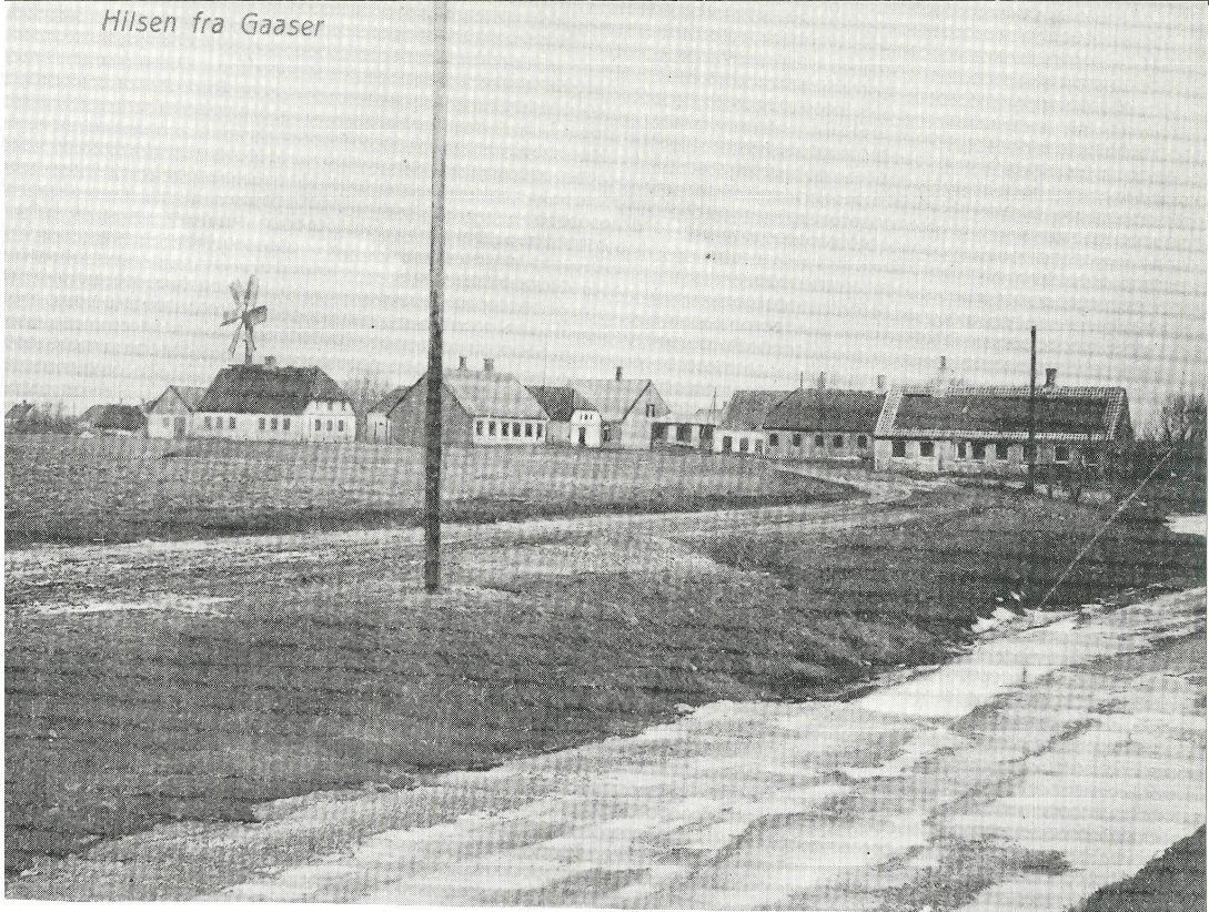
Gaaser set fra nord. Øverst ca. 1980. Nederst ca. 1910