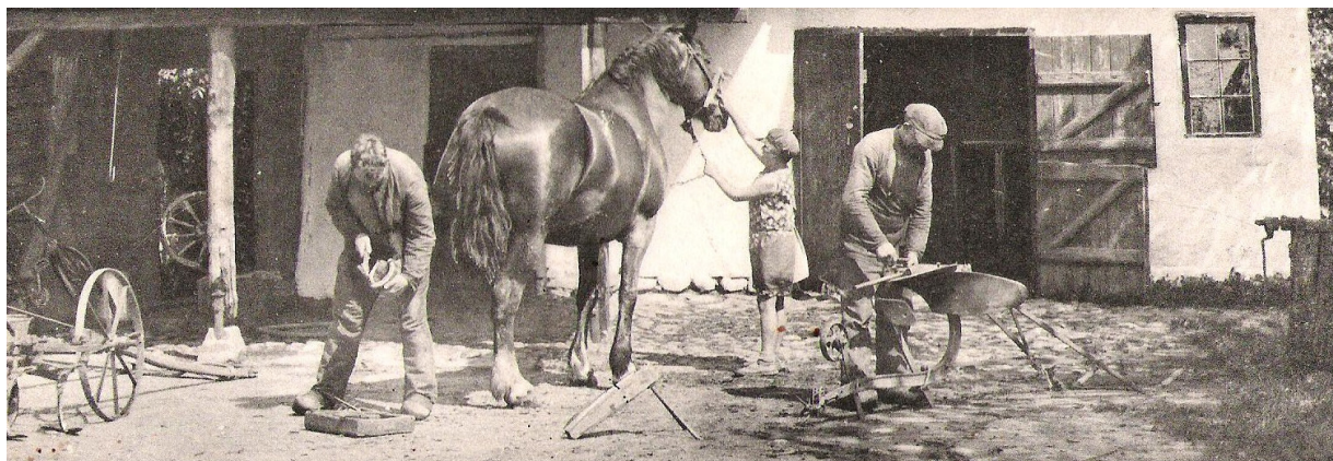
Gammelt billede, der viser en smed og hans svend i arbejde. Billedet er ikke fra Gaaser.