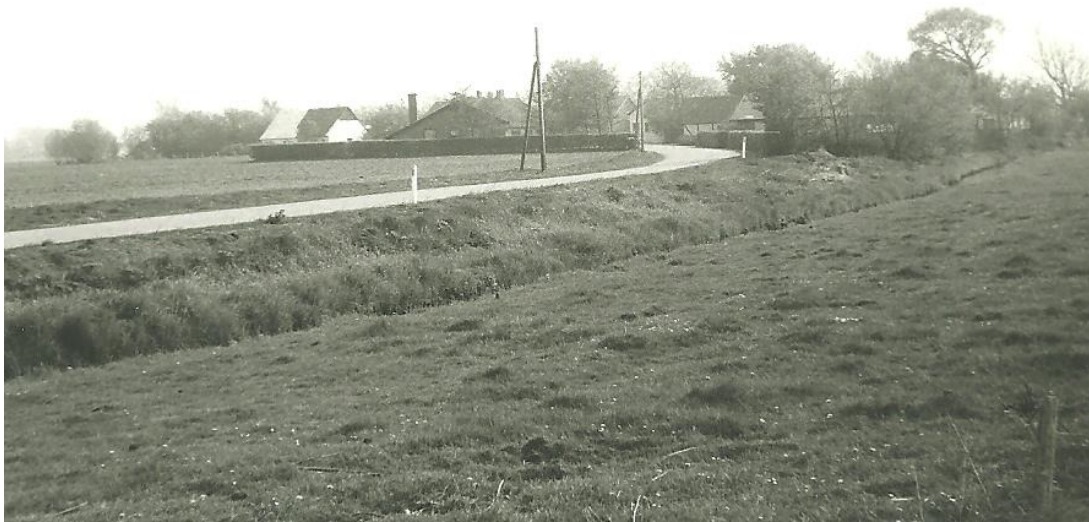
Hilsen fra Gaaser