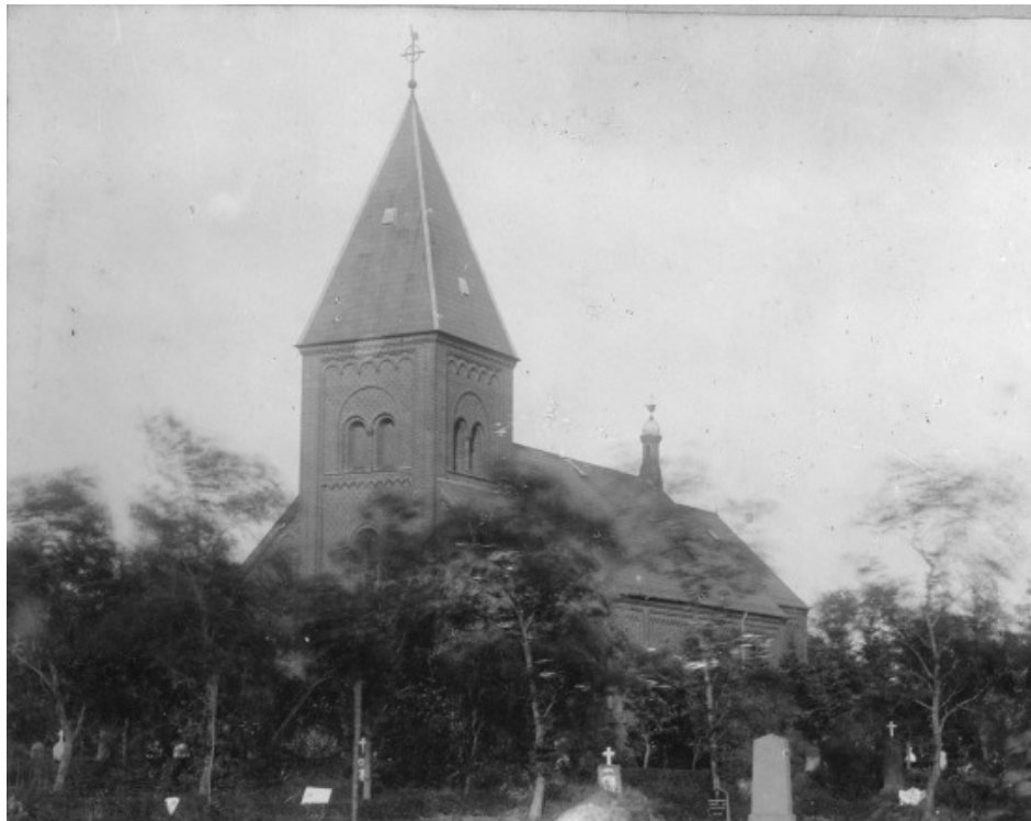
Øster Hassing kirke fotograferet i perioden 1900-1910.