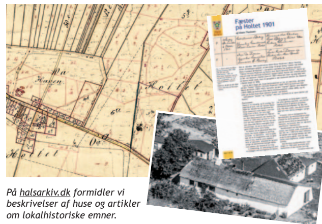
På halsarkiv.dk formidler vi beskrivelser af huse og artikler om lokalhistoriske emner.

HUSK at skrive dine adresseoplysninger i meddelelsesfeltet - eller send en mail til info@halsarkiv.dk - hvor du oplyser navn, adresse, evt. mail-adresse og skriver, at du har betalt.