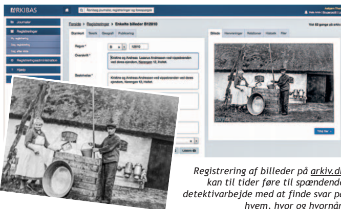
Registrering af billeder på arkiv.dk kan til tider føre til spændende detektivarbejde med at finde svar på hvem, hvor og hvornår.

Vi modtager helst de originale dokumenter, som bliver omhyggeligt registreret, sikkert opbevaret og gjort tilgængelige for interesserede.