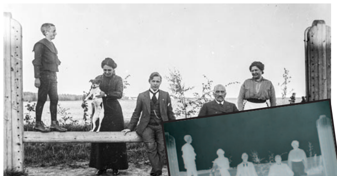
Hals Arkiv har kvalitetsudstyr til scanning af papirbilleder og negativer.

Billeder - Hals Arkiv modtager både som originalbilleder (papir, negativer og dias) og som digitale billeder. Vi modtager både som gave eller som lån. Lånte billeder bliver efter skanning afleveret til giveren.