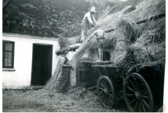
Taget tækkes på Nejsigbro.