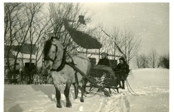
På vej til Ulsted Mølle med korn i snevej. Hals Arkiv B16768