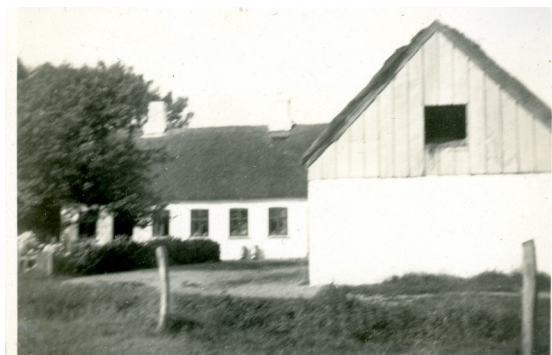
Nejsigbro Hals Arkiv B8352