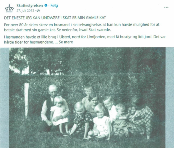
Skattestyrelsens facebookopslag den 27. juni 2015