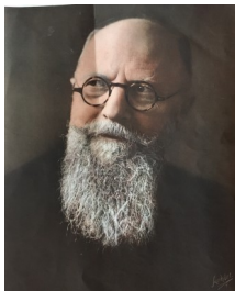
Thorvald Stauning - socialdemokratisk statsminister i 1924-1926 og 1929-1942.