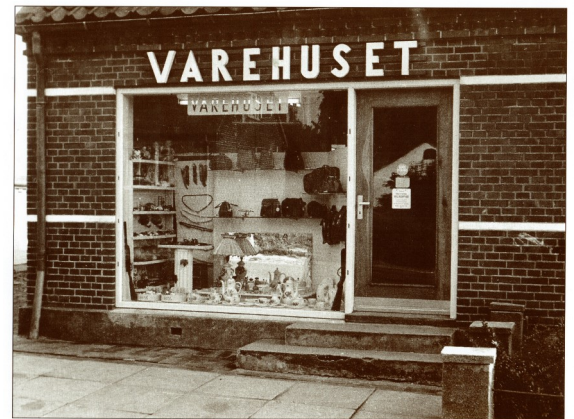
Varehuset på Halsvej 260 (foto fra midten af 1950-erne)