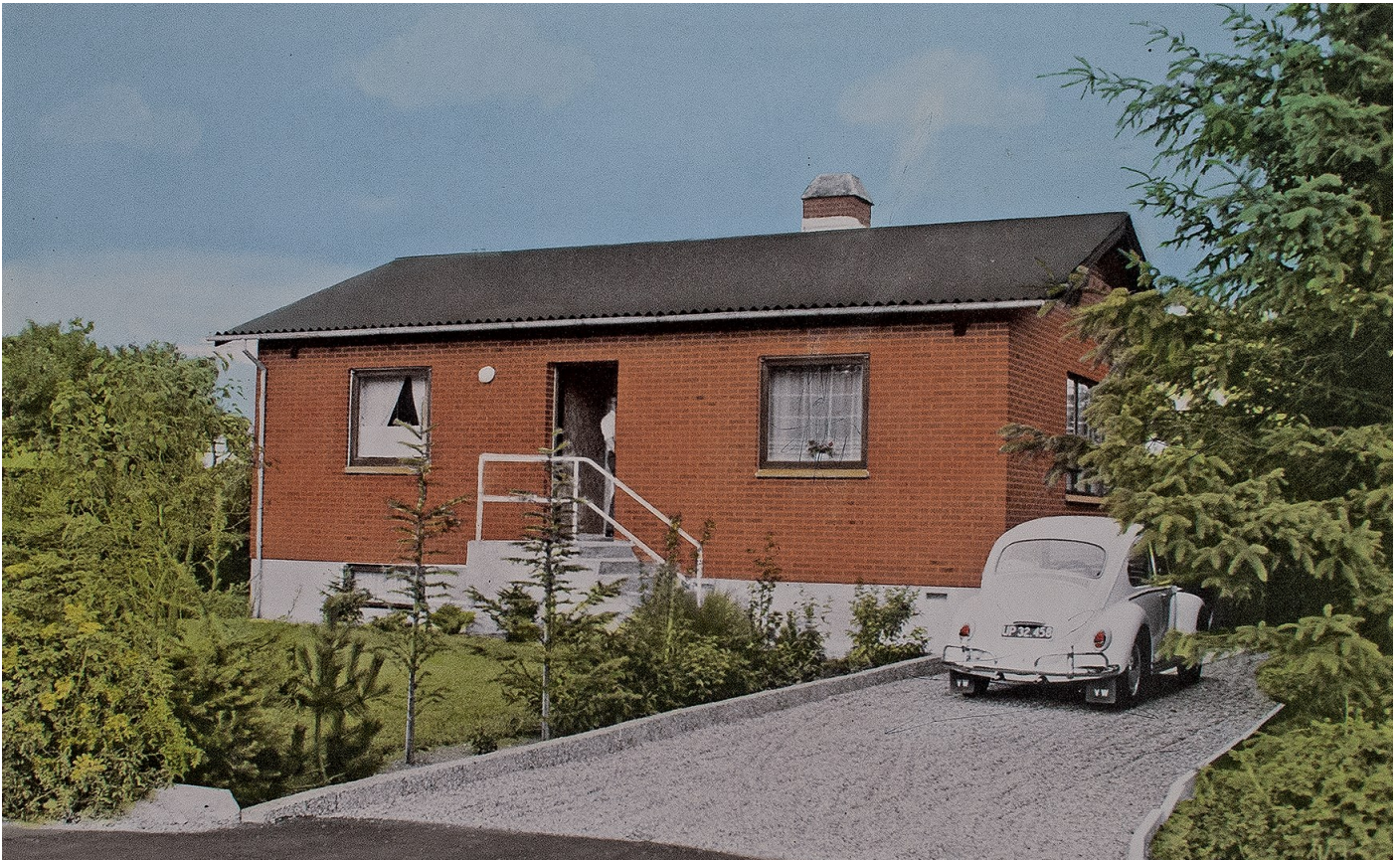
Foto af Parallelvej 14 fra ca. 1960-70.