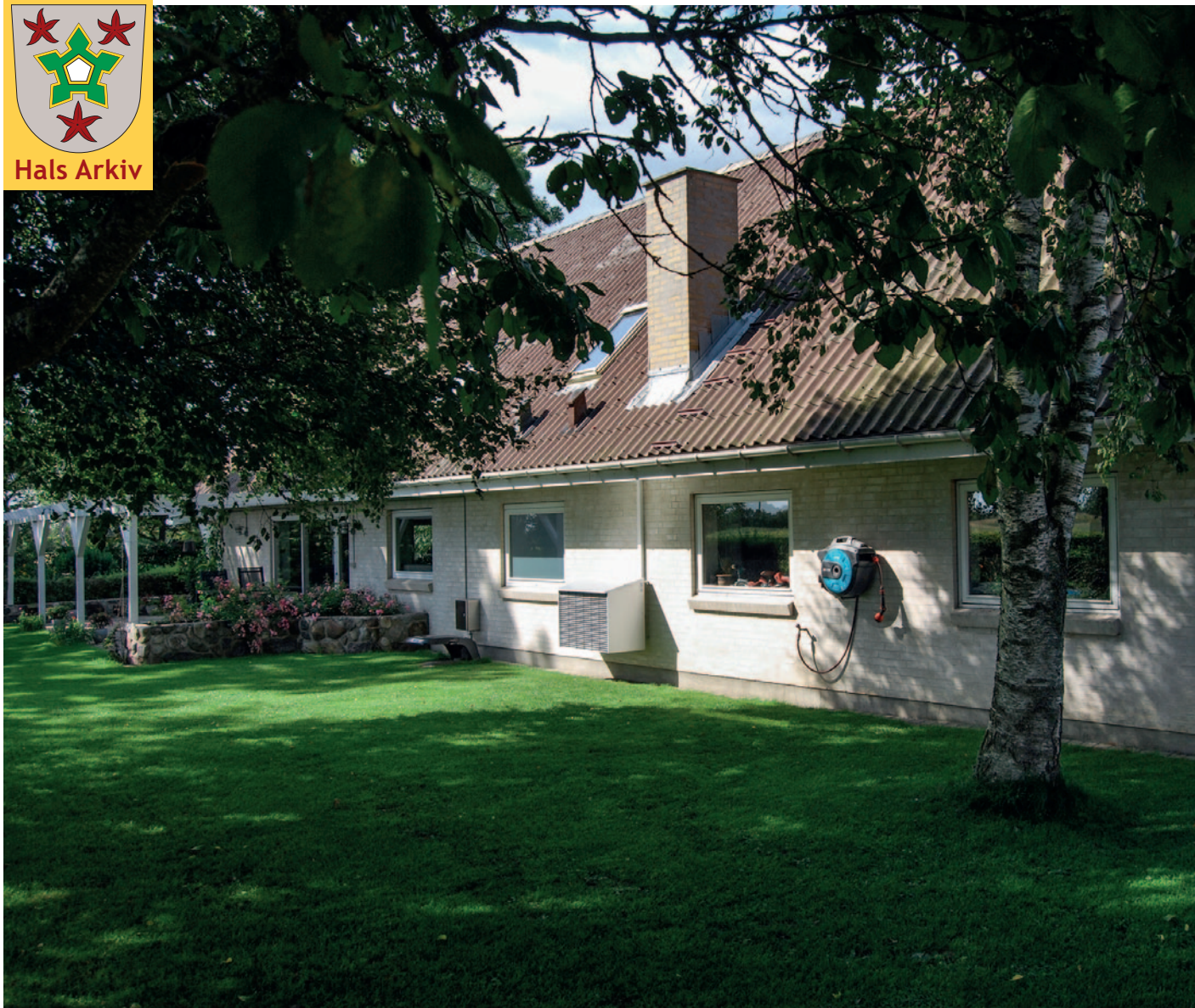
Danielsminde, Holtetvej 60 fotograferet fra haven i 2023.