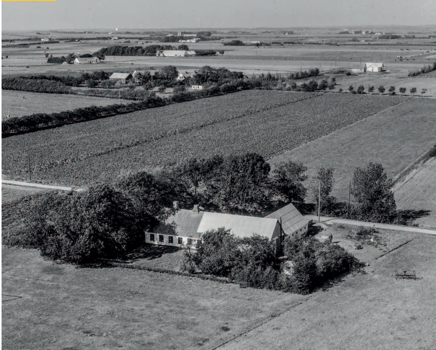
Holtetvej 60, fotograferet i 1959.