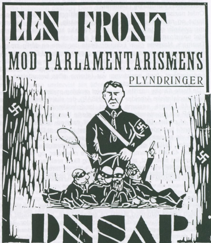
Forside af DNSAP's partiavis Nationalsocialisten, søndag den 26. februar 1933.