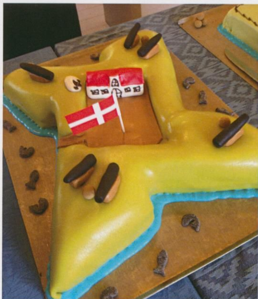
Den store kage af Hals Skanse, fra Mejdahls Bageri, var pyntet med tøjhus, krudtkammer og kanoner og vakte stor begejstring hos museets medarbejdere og gæster ved åbningsreceptionen.

Der er dog også sket andre forandringer på Hals Museum i årets løb. Museet har valgt at afhænde administrationsbygningen kaldet "Toften", og satser nu på, at arbejde videre med planerne om en fuld istandsættelse af Hals Skanse. I år renoverede Aalborg Kommune museets Tøjhus, som fik istandsat murværk og sokler, og i løbet af de kommende par år følger udskiftning af vinduer, døre og tag.