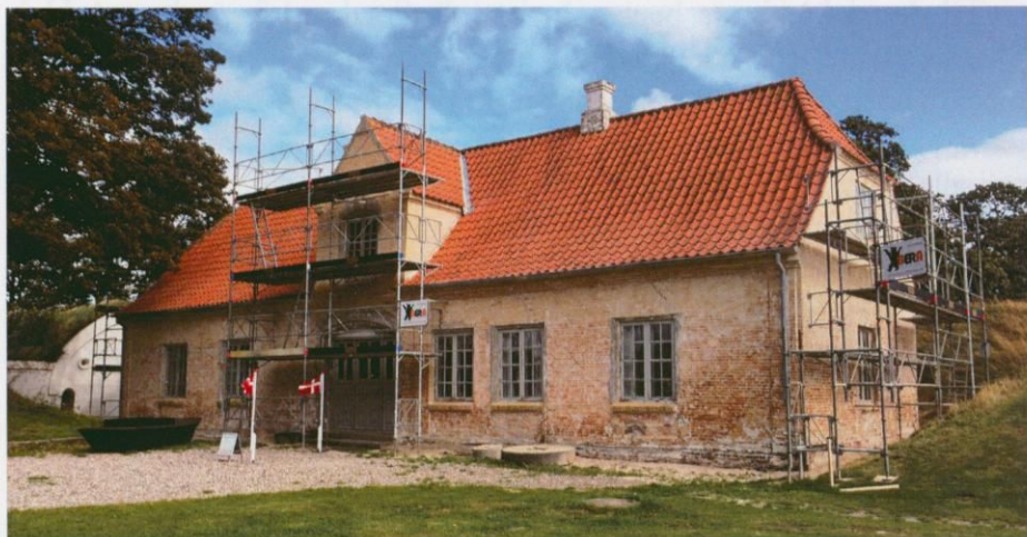
Museets murværk blev istandsat i løbet af efteråret 2014. Til foråret 2015 bliver museet kalket hvidt og bliver igen en flot bygning.

For Hals Museum har 2014 været et år med mange gode oplevelser, hvor museets medarbejdere har lagt sig i selen for at få så gode udstillinger og arrangementer som muligt med den hensigt, at skabe en nærværende og vedkommende fortælling om Hals og Hals Skanse. Vores anstrengelser er også lykkedes et langt stykke hen af vejen. Ikke mindst er museet kommet op af det besøgmæssige dødvande, som har præget museet i de sidste par omtumlede år, og havde i 2014 et besøgstal på 9.100 besøgende. Til sammenligning havde museet knap 3.000 besøgende i 2013. Dette tror vi skyldes, at museet har haft arbejdsro til videre udvikling af udbuddet af arrangementer, og gennem udvidelse af samarbejdet med Hals Museumsforening og Arkiv og Infocenter Hals. I 2014 bød museet på to nye arrangementer; en soldaterdag på kristihimmelfartsdag for børn med fokus på soldaterlivet i 1800-tallet. Dagen var fyldt med masser af børn, som var oplagte til både at smage på gule ærter med flæsk og kål, at lade sig forbinde på lazarettet og indgå i skarp træning i sværdfægtningens svære kunst.