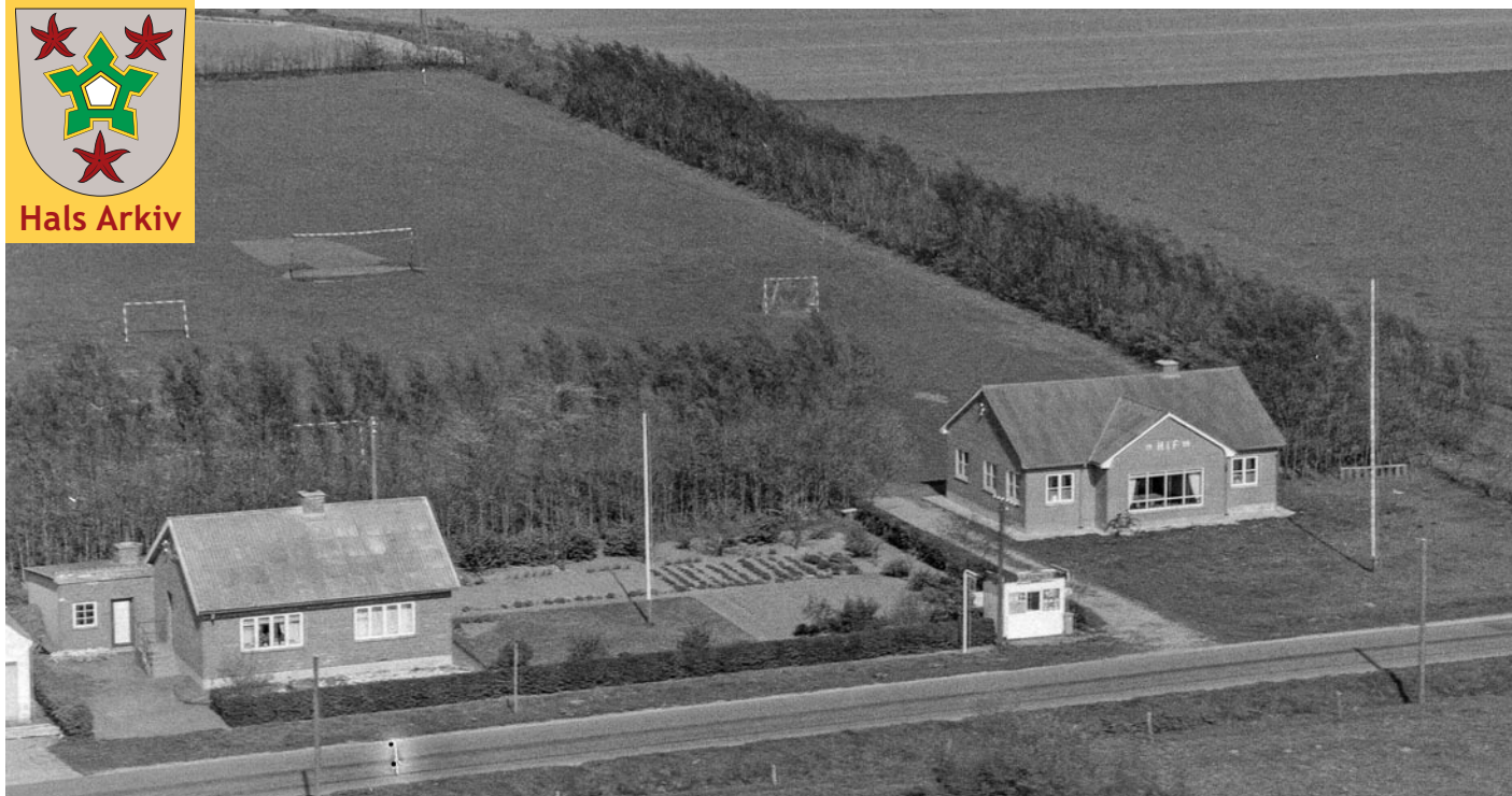
Luftfoto af Holtet Idrætsforenings klubhus, der blev indviet i 1955.