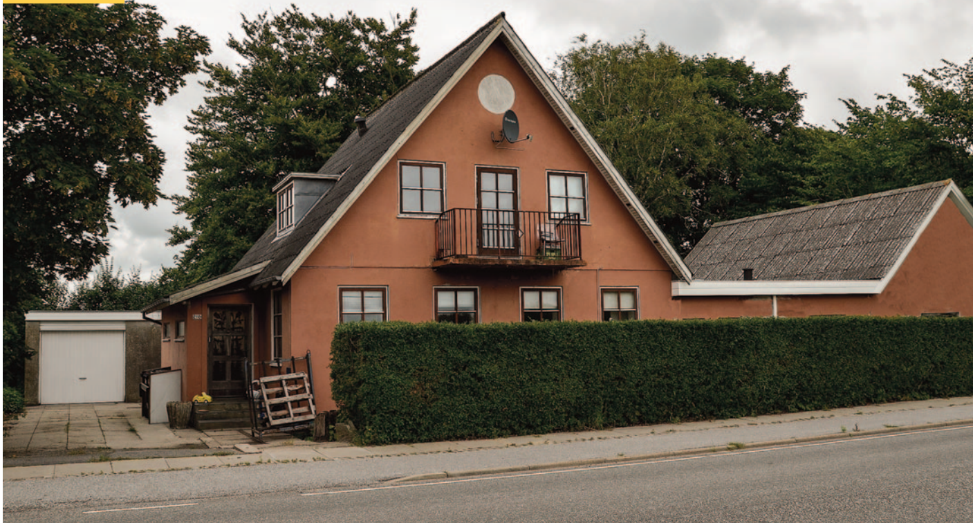
Aalborgvej 216 fotograferet 2024.