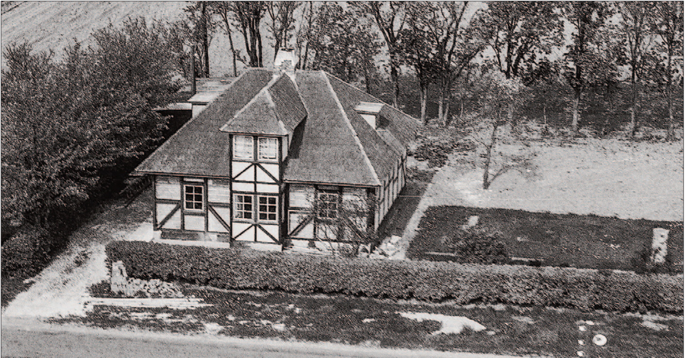
Luftfoto af Aalborgvej 218 taget i 1965.