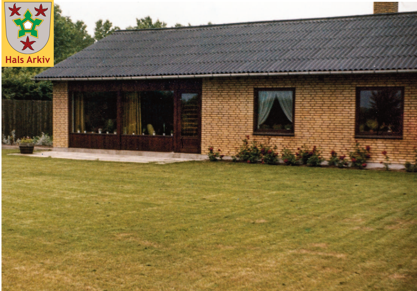
Knud Pedersens nybyggede villa på Aalborgvej 227 fotograferet i 1967.