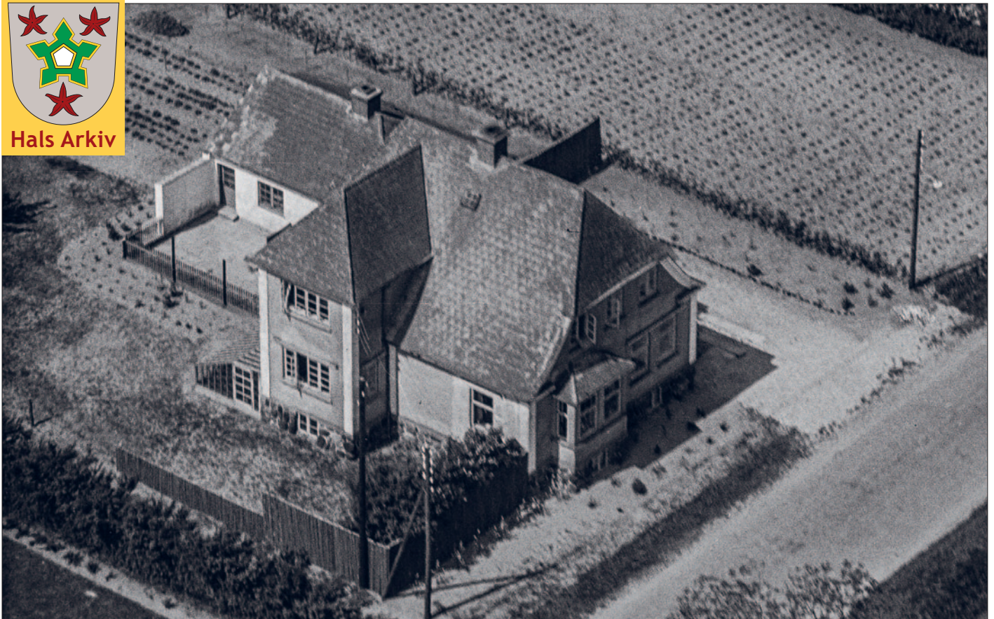
Aalborgvej 321 fotograferet fra havesiden i 1950.