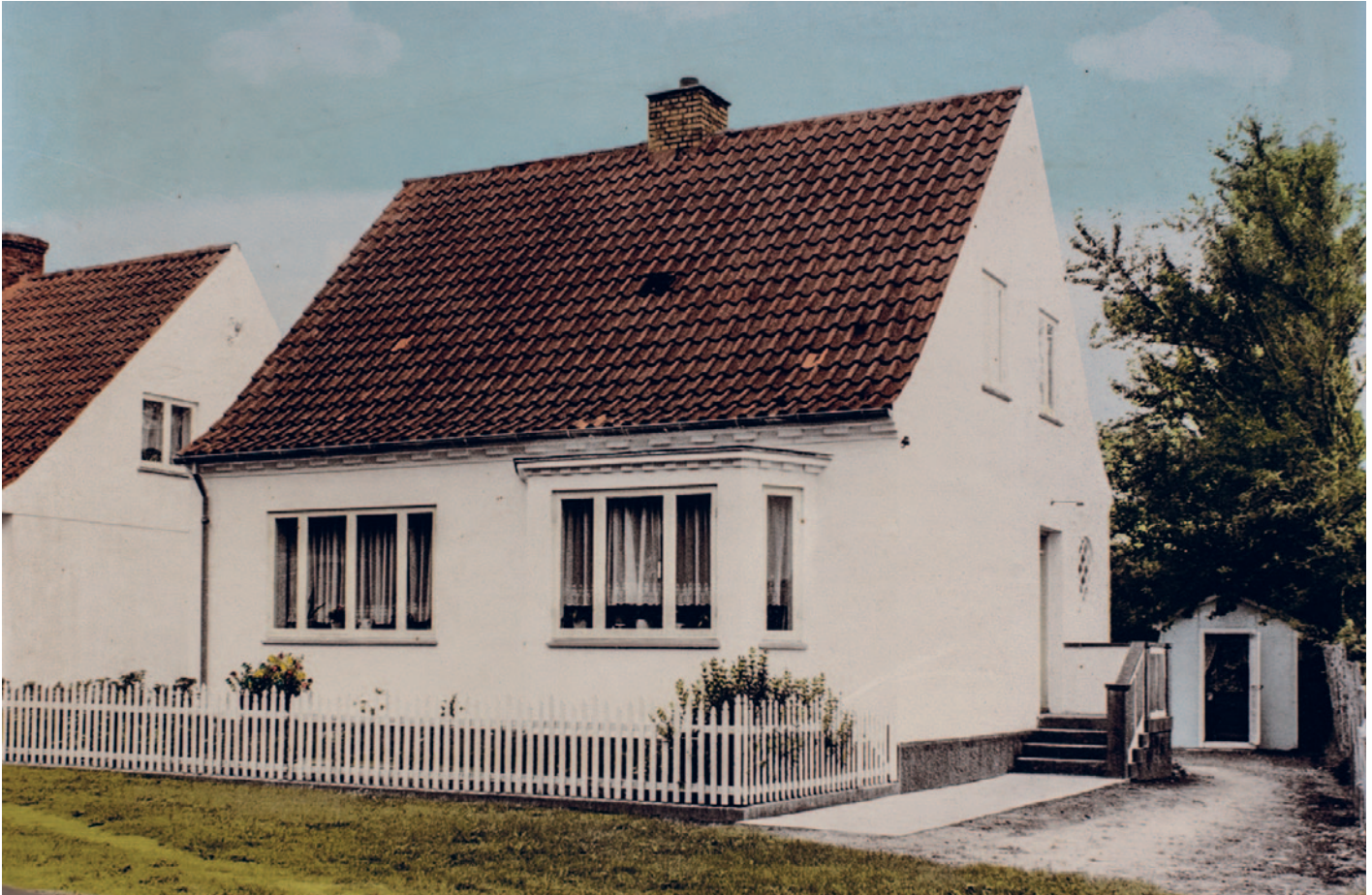
Villaen på Aalborgvej 237 Fotograferet mellem 1950 og 1955.