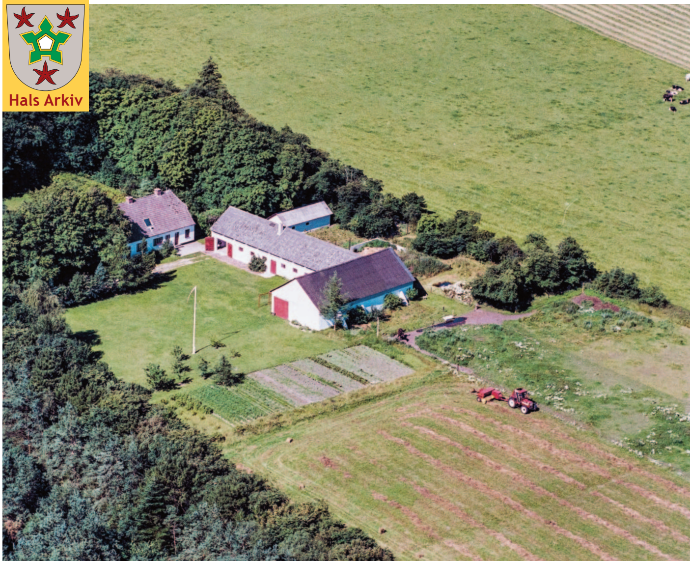
Aagaard på Nørengen 13 fotograferet i 1990.