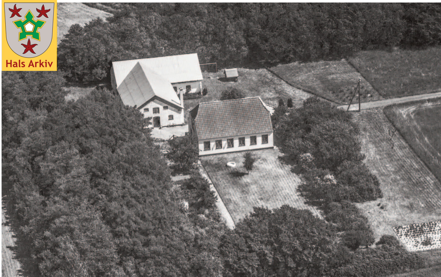
Nøringen 15 på Holtet fotograferet fra luften i 1974