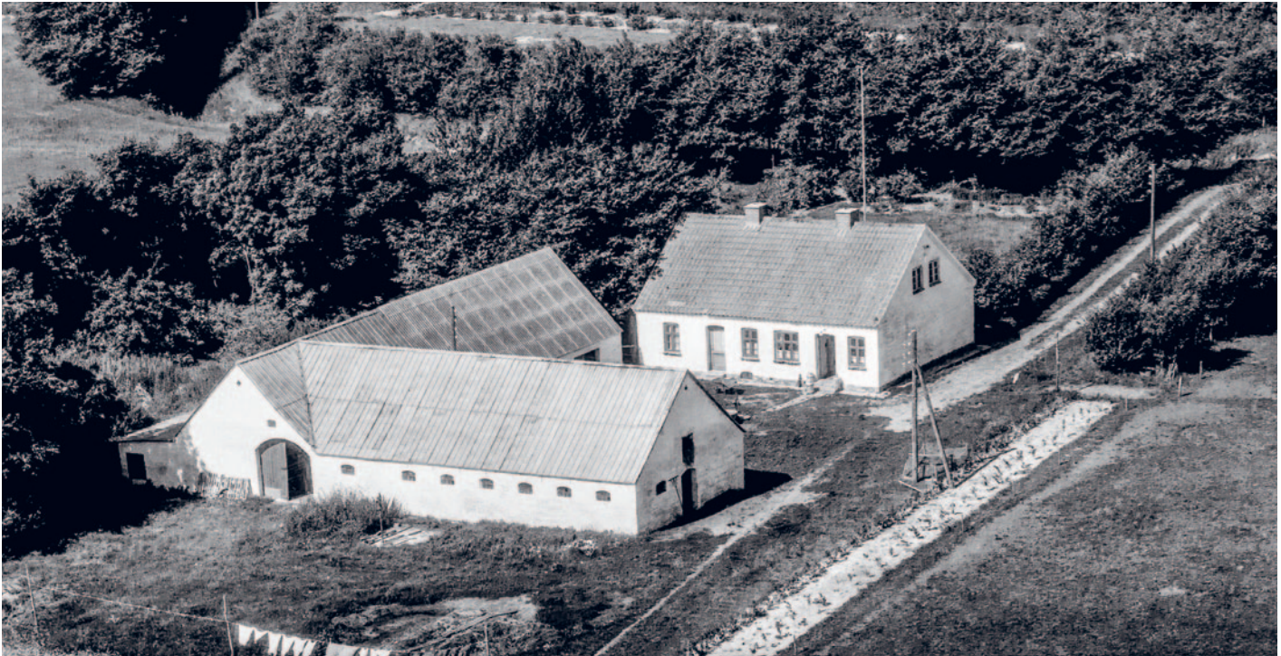
Nørengen 18, fotograferet i 1948-1952.