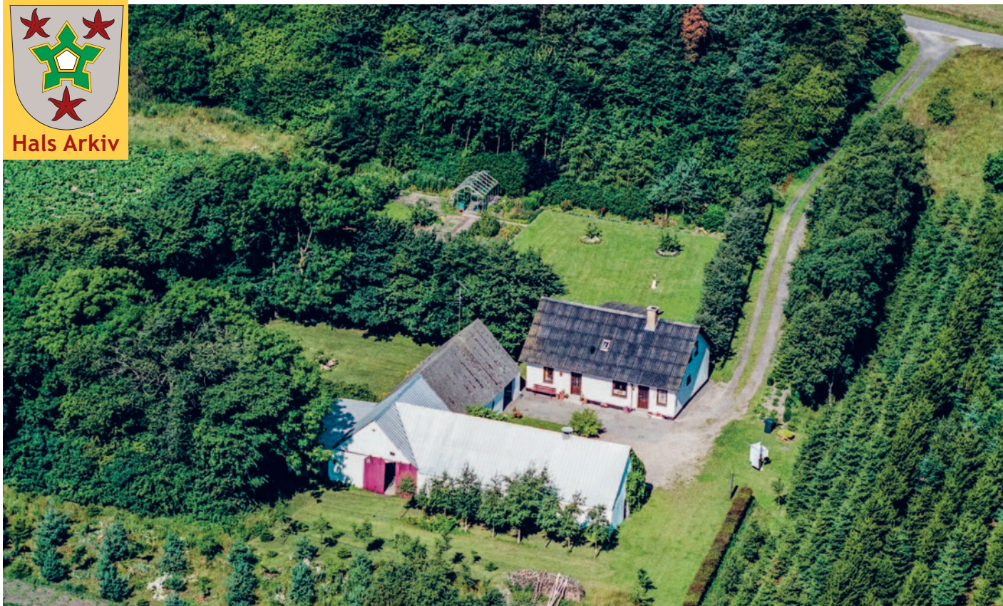
Nøringen 18 på Holtet fotograferet fra luften i 1990.