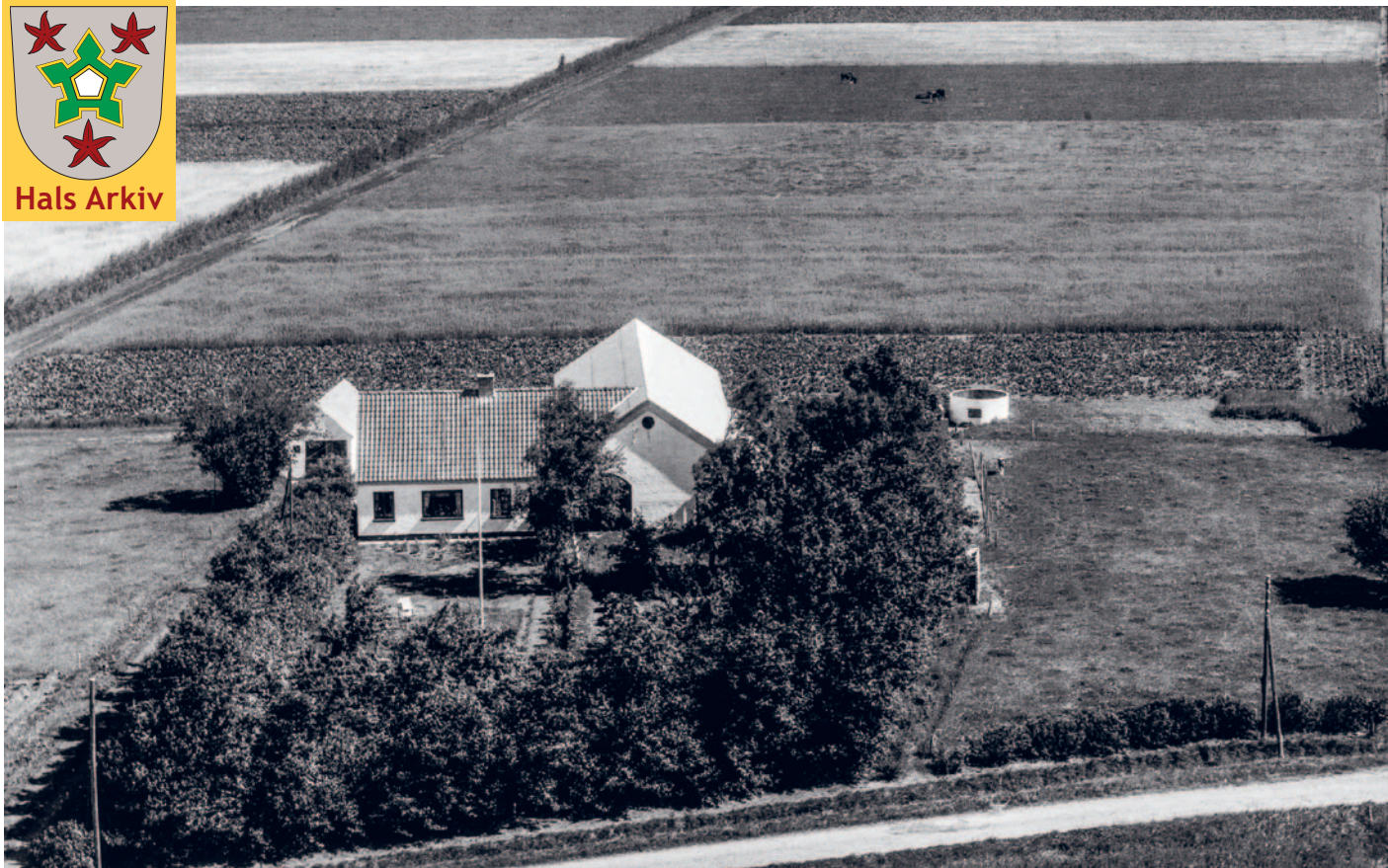
Nøringen 30, Kærbo, Holtet fotograferet fra luften i 1961.

Foto: Aalborg Luftfoto, Det kgl. Bibliotek. Hals Arkiv, B22710.