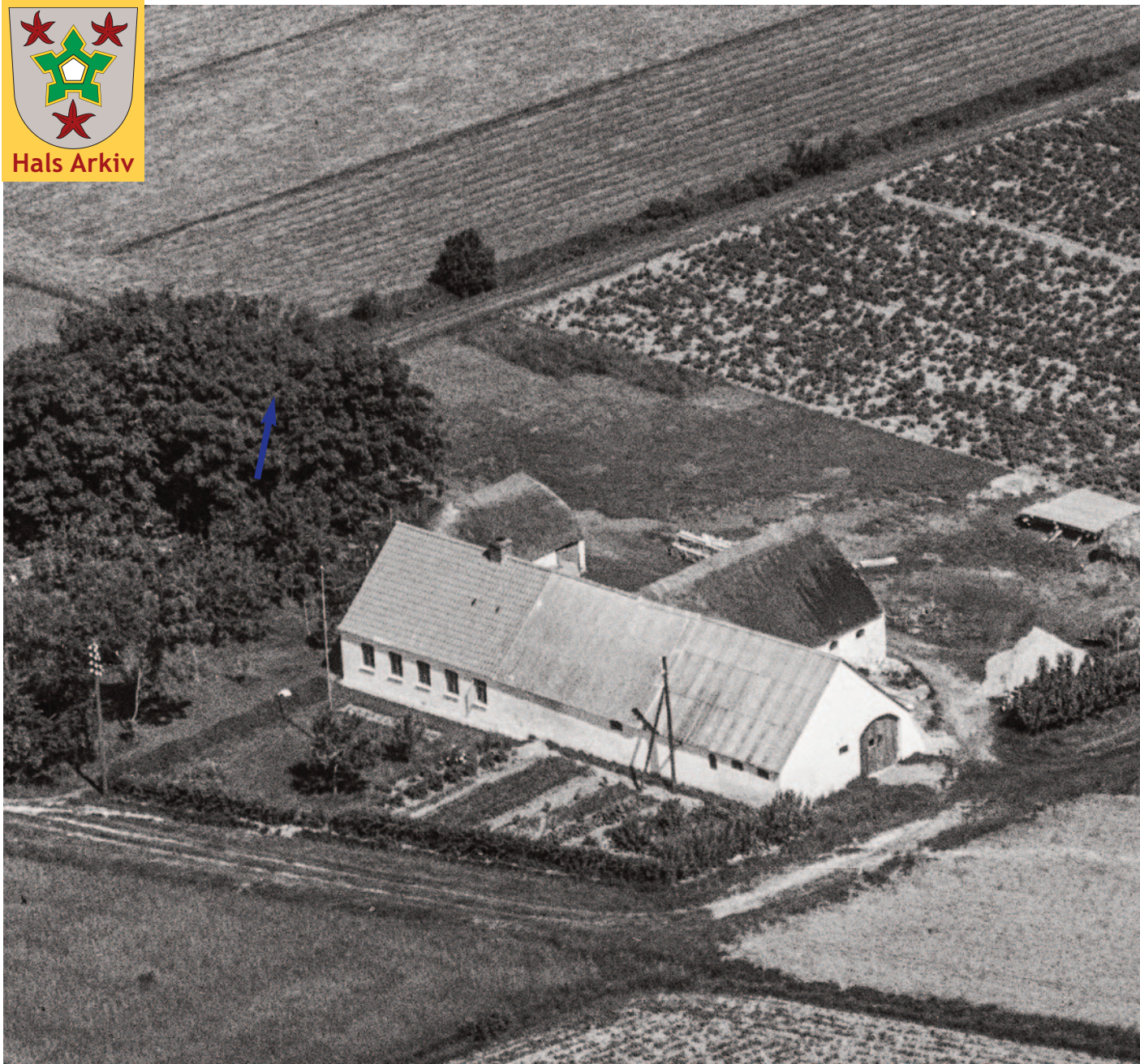
Luftfotoet af Nordkær 6, Holtet, er fra 1948-1952.