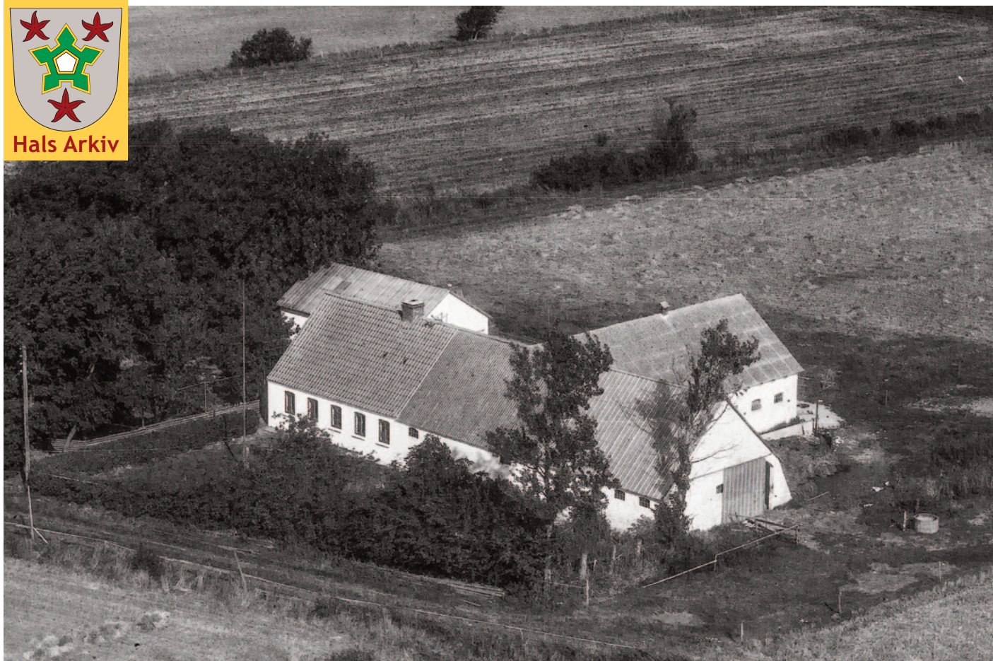
Luftfotoet af Nordkær 6, Holtet, er fra 1967.

Foto: Aalborg Luftfoto, Det kgl. Bibliotek. Hals Arkiv, B22753.