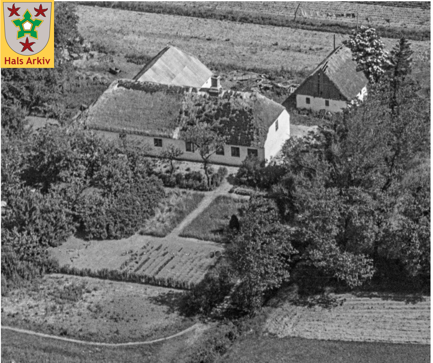
Holtetvej 14, Holtet, er her fotograferet mellem 1948 og 1952.

Foto: Aalborg Luftfoto, Det kgl. Bibliotek, Hals Arkiv, B14878.