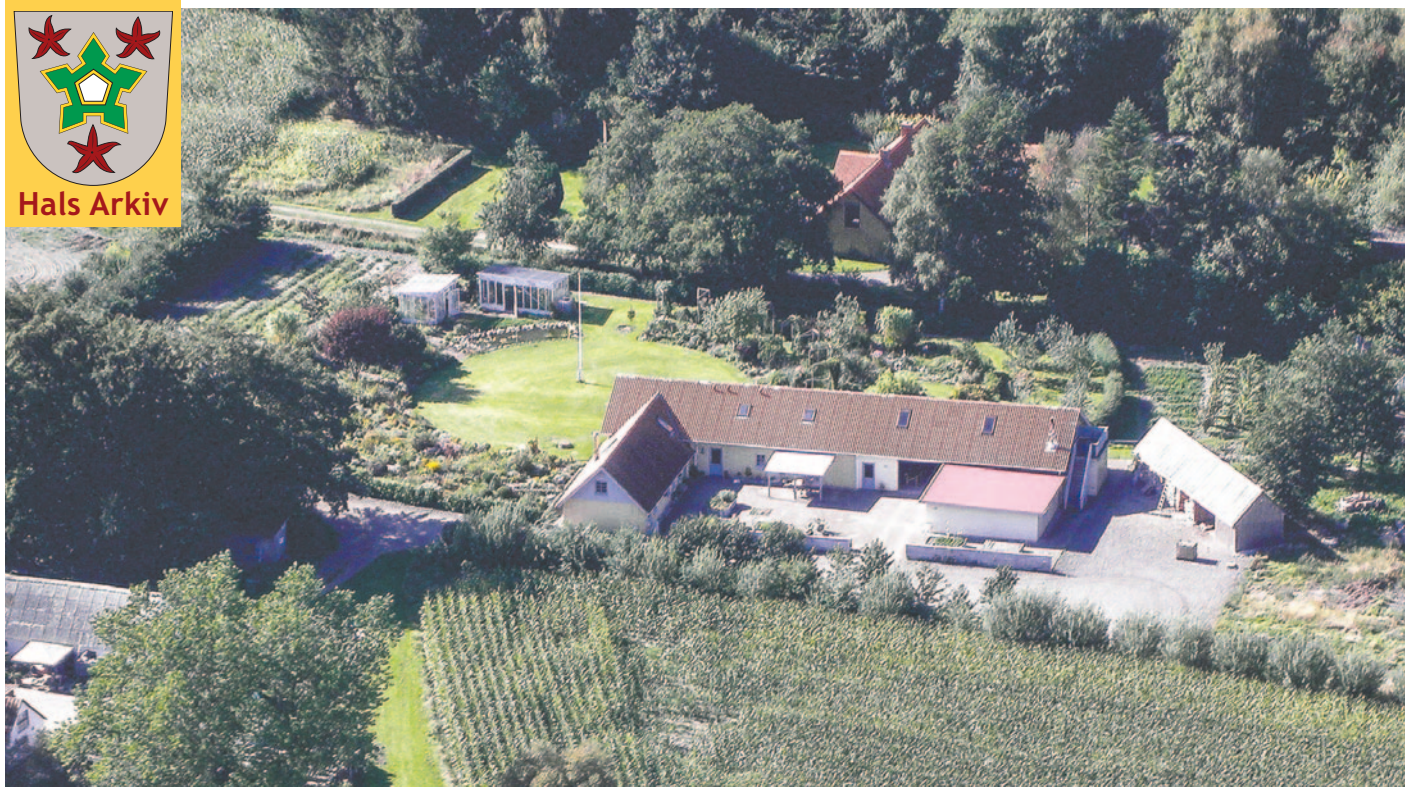
Luftfoto af Holtetvej 16, taget i 2014.

Foto: Mathias Bruun, Hals Arkiv, B12741.