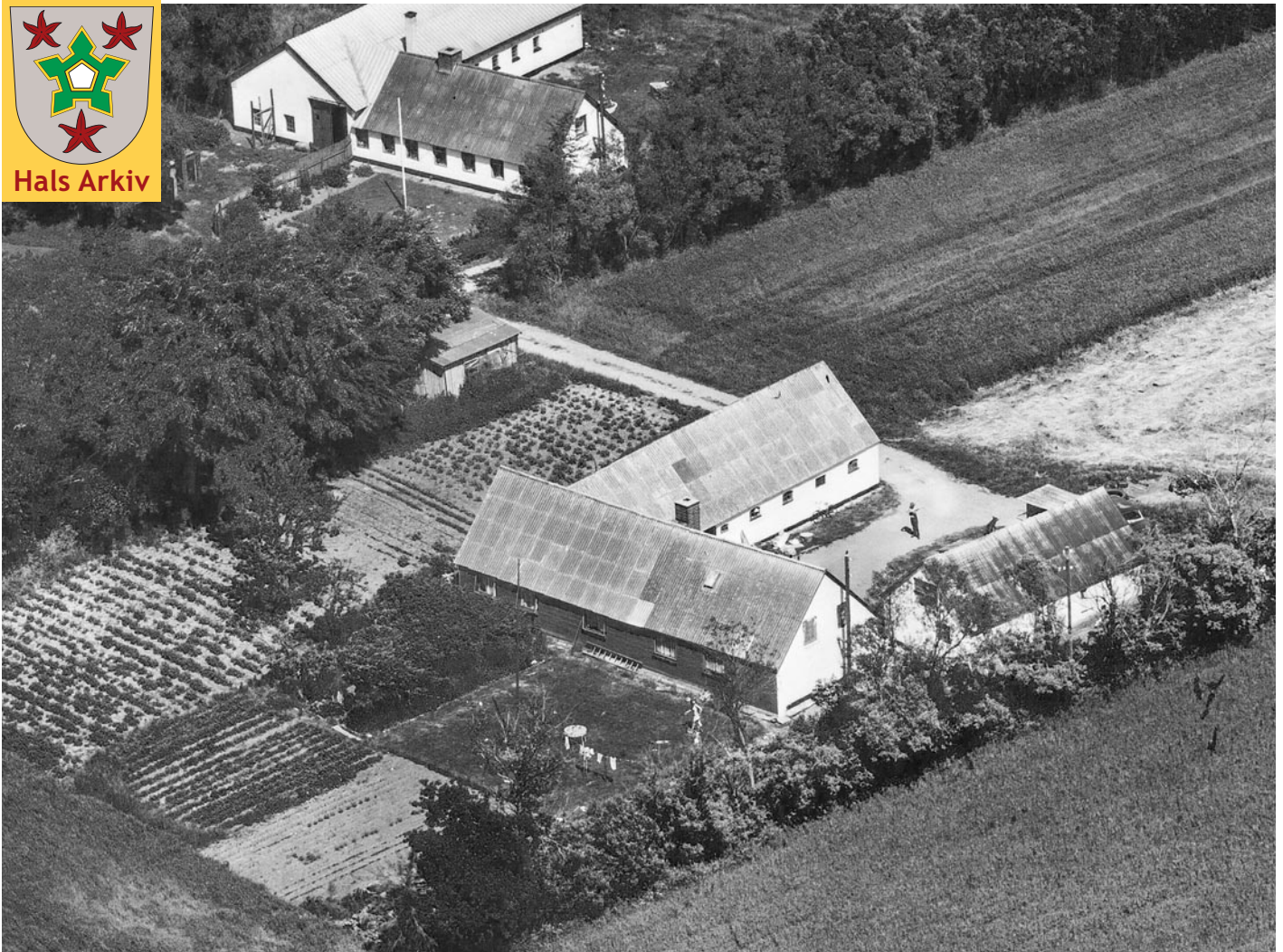
Luftfoto af Holtetvej 18, taget i 1974. I baggrunden Holtetvej 16.