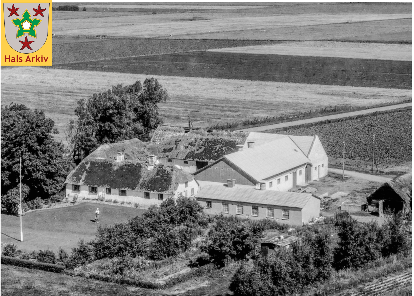
Luftfoto af Holtetvej 32, Holtet, fra 1961.

Foto: Aalborg Luftfoto, Det kgl. Bibliotek. Hals Arkiv, B23117.