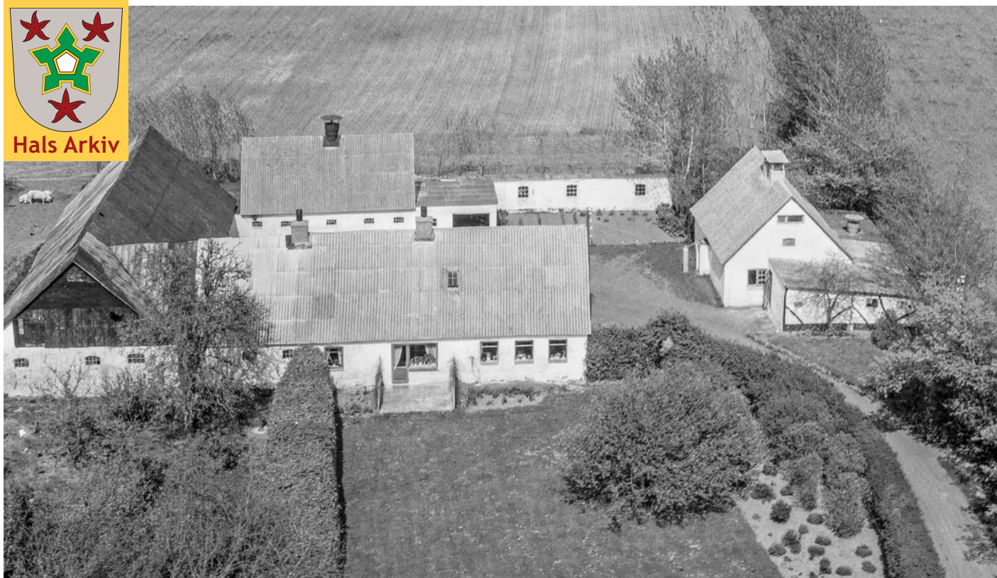
Luftfoto af Nygaard på Nøringen 36 fra 1965.

Foto: sylvest Jensen, Det kgl. Bibliotek, Hals Arkiv, B22881.