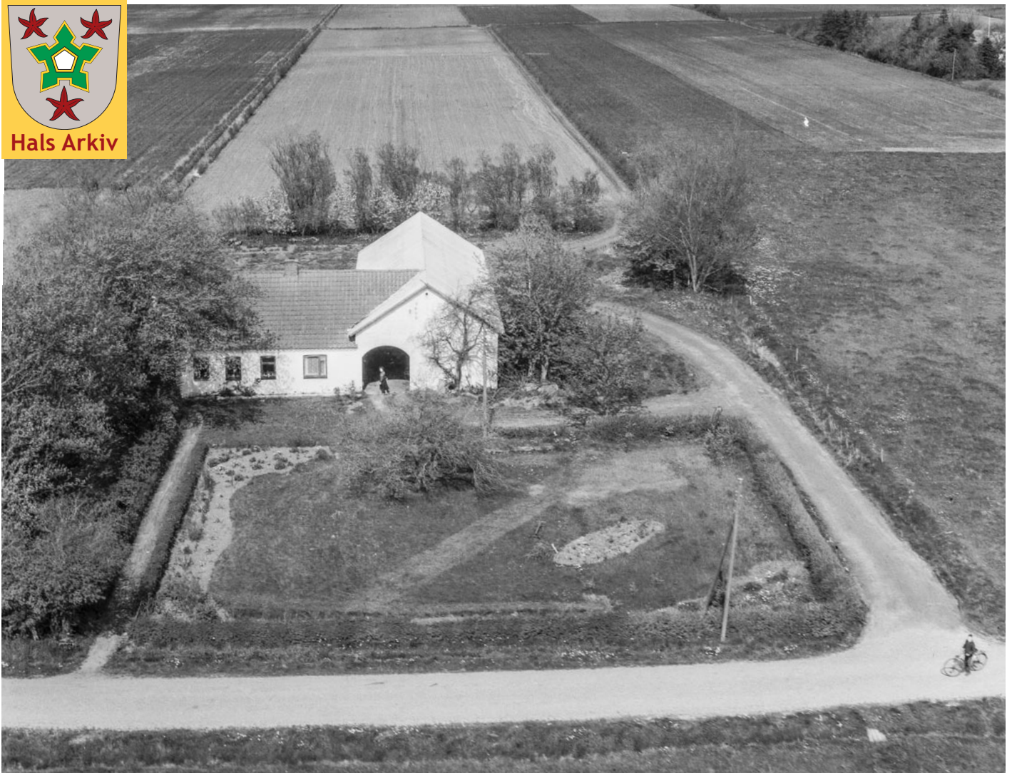
Nøringen 40, fotograferet i 1965.

Foto: Sylvest Jensen, Det kgl. Bibliotek, Hals Arkiv, B22909.