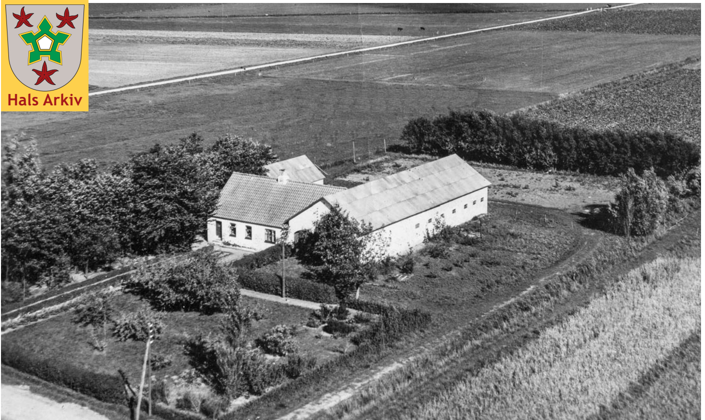
Havekær på Nøringen 40, Holtet, fotograferet i 1951.

Foto: Sylvest Jensen, Det kgl. Bibliotek, Hals Arkiv, B22907.