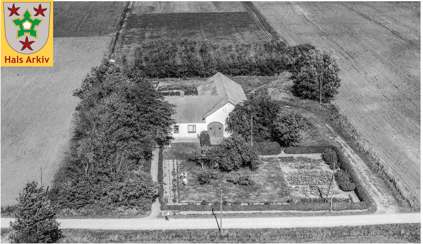
Luftfoto fra 1959 af Nøringen 40, Holtet, med børn i haven.