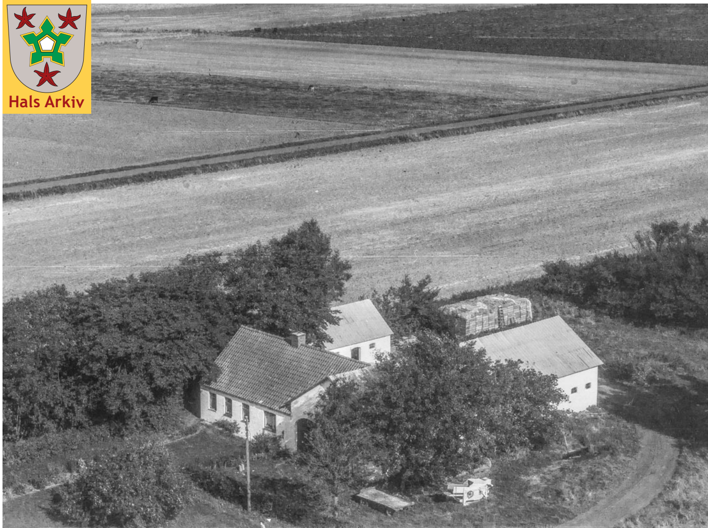
Nøringen 40, også kaldet Havekær, fotograferet 1967.

Foto: Aalborg Luftfoto, Det kgl. Bibliotek, Hals Arkiv, B22910.