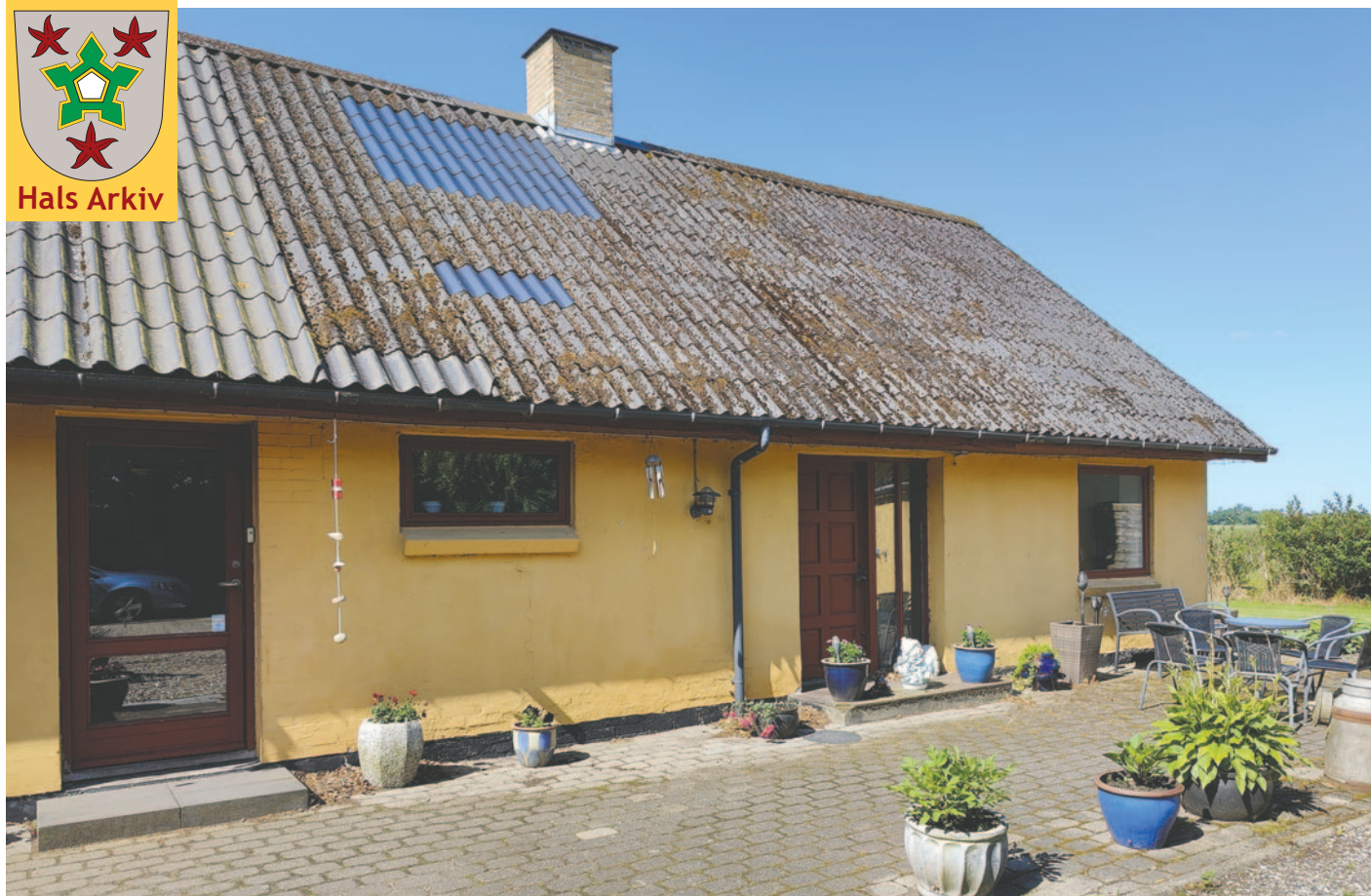
Nøringen 40 fotograferet sommere 2025.