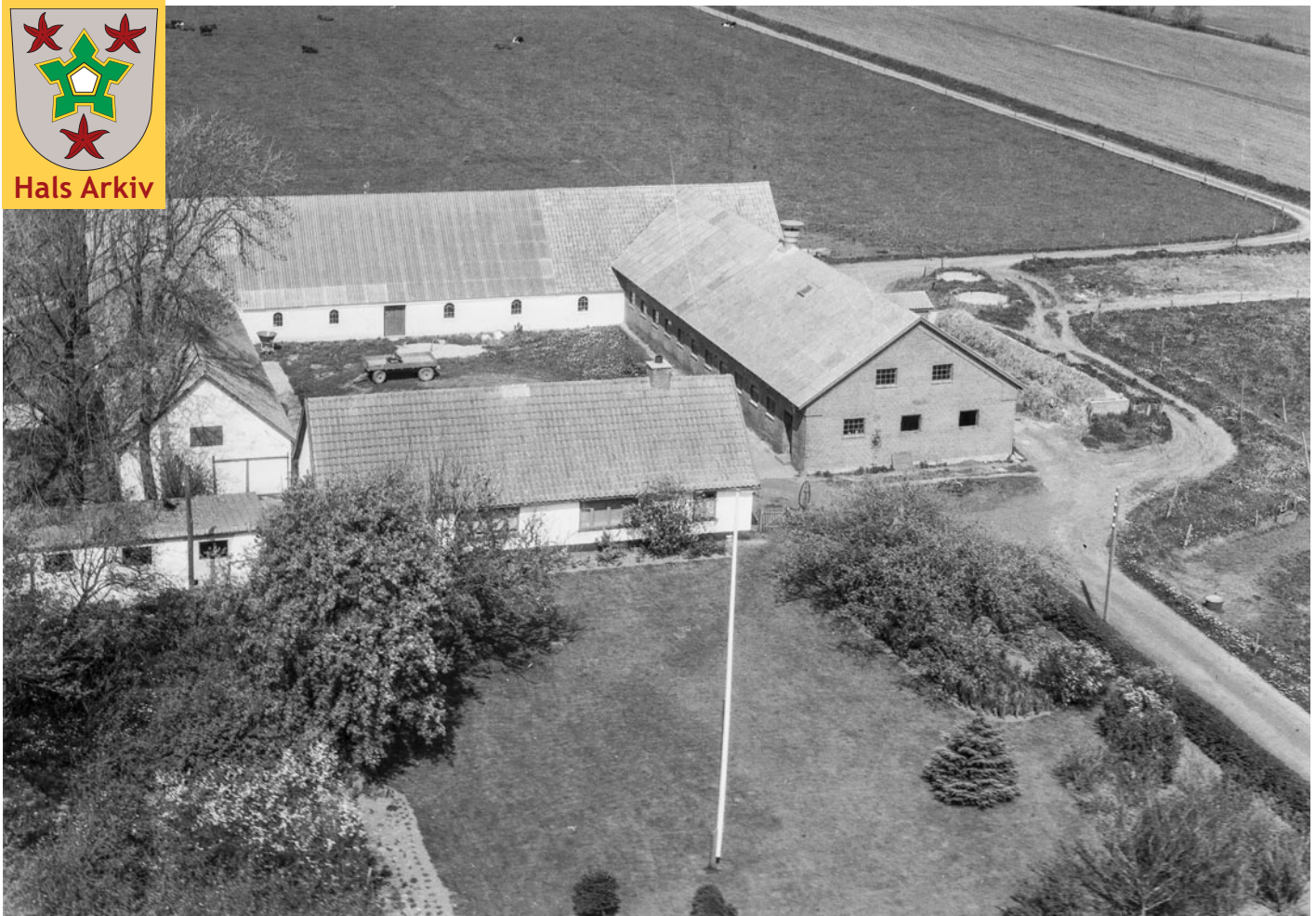
Luftfotoet af Nordkær 10, Holtet, fra 1955.