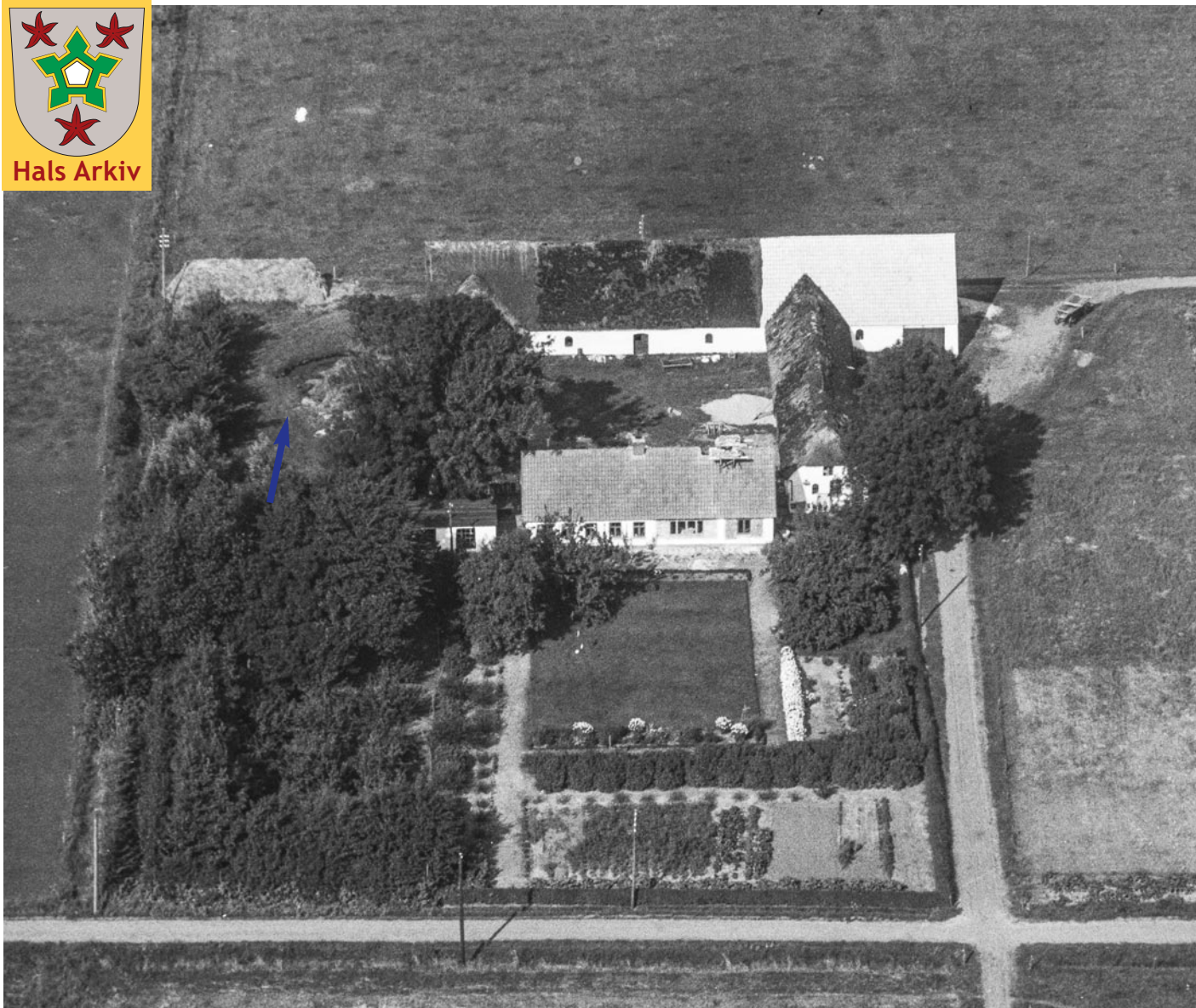
Luftfotoet af Havrebæk på Nordkær 10, Holtet, er fra 1946.