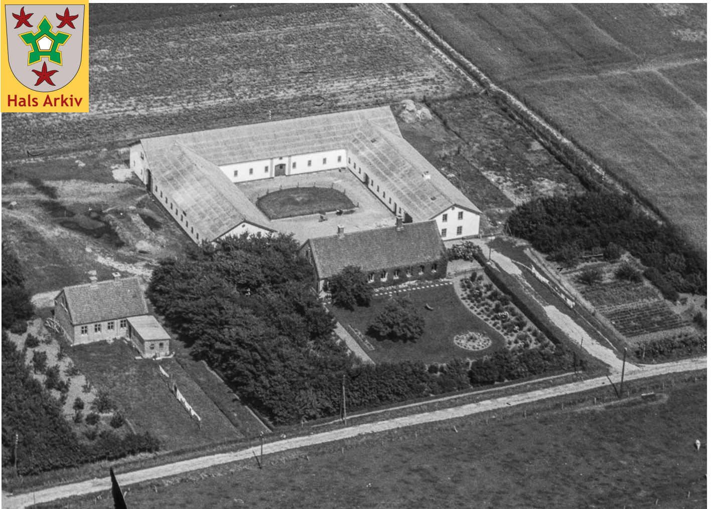
Thomasminde, Nordkær 16 og aftægthuset, Nordkær 18, fotograferet i 1946.

Foto: Sylvest Jensen, Det kgl. Bibliotek, Hals Arkiv, B22827.