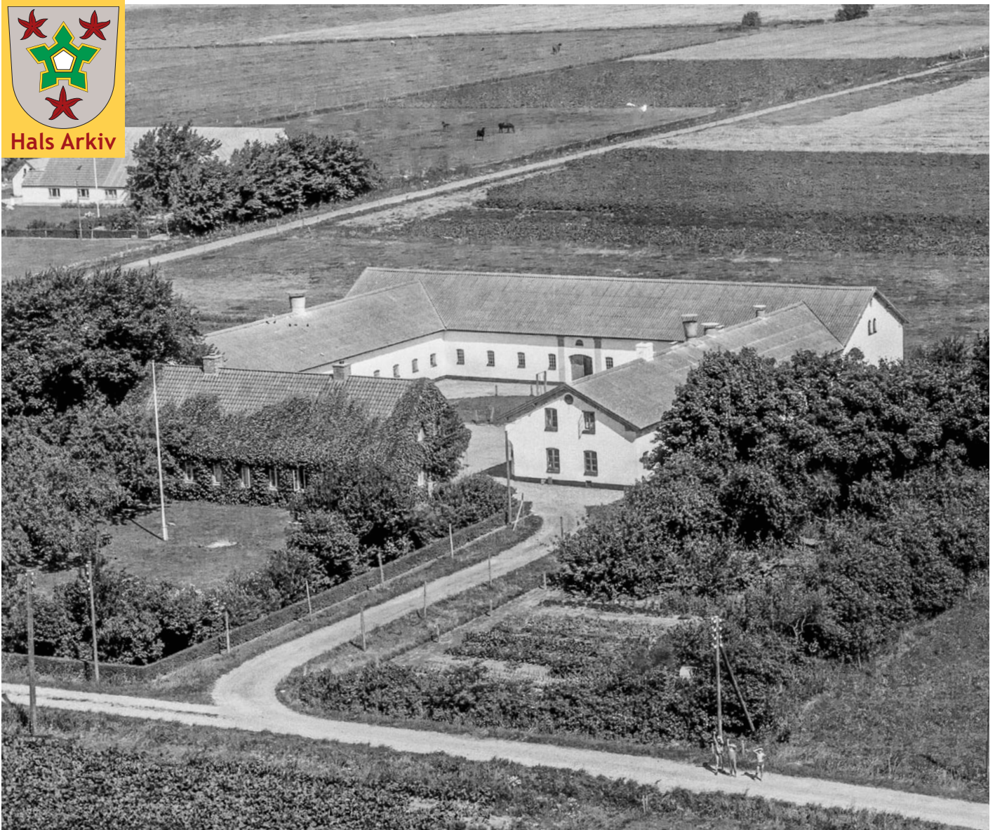
Luftfotoet af Thomasminde Nordkær 16, Holtet, fra 1961.

Foto: Sylvest Jensen, Det kgl. Bibliotek. Hals Arkiv, B22828.